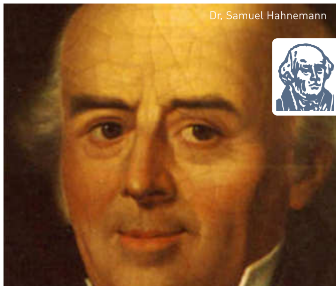
Dr. Samuel Hahnemann

Neben den funktionellen Übungen kommt auch der gesellige Teil nicht zu kurz.