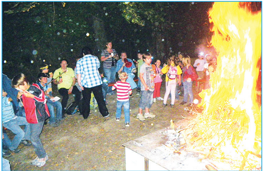
Gute Stimmung am Lagerfeuer im Höfforst

Nachdem sich alle Nachtwanderer den Imbiss hatten schmecken lassen, versammelten sich alle am Lagerfeuer,