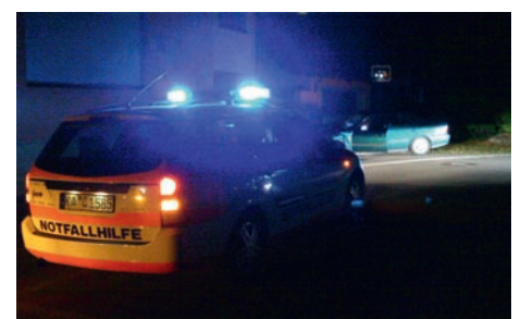
Verkehrsunfall in Weingarten

Von Januar bis Ende Juli konnten wir, das Team der NOTFALLHILFE, insgesamt 162 Einsätze absolvieren und damit nochmals unsere Präsenz unterstreichen. Besonderheiten in diesem Halbjahr waren z.B. im Februar 6 Nachteinsätze in 5 Folgetagen, im März können wir auf eine erfolgreiche Reanimation zurück blicken, im Juni wurden wir in 24 Stunden 7 Mal alarmiert. Bis Ende Juli hat das Team 8013 Bereitschaftsstunden geleistet.