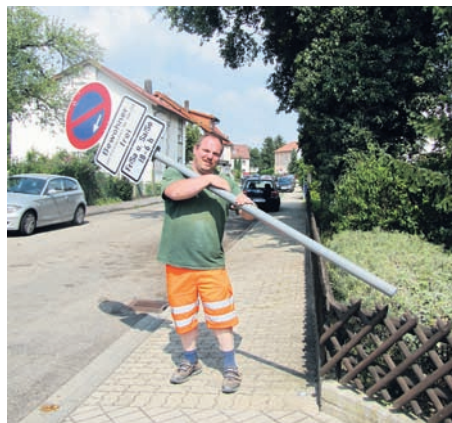
Die Halteverbotsschilder in der „Bewohnerparkzone“ werden entfernt