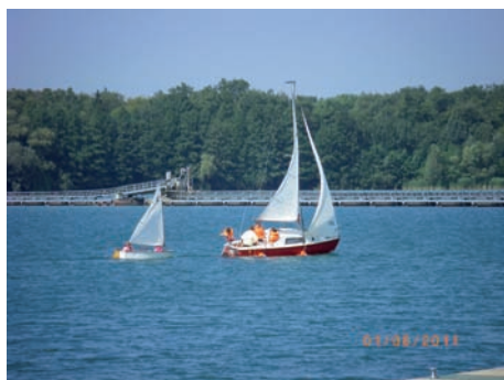
Wettrennen mit dem Dickschiff

Renner waren die Kajaks und die Surfbretter. Die Optis wurden von Mitgliedern der Jugendgruppe „Segeln“ des SSK gesteuert und nahmen wechselweise jeweils einen „Passagier“ mit.