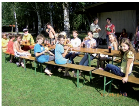
Bratwurst und Getränke zum Abschluß

Uns, den Helfern hat der Nachmittag auch viel Spaß gemacht. Vor allem weil es den Kindern offensichtlich großen Spaß gemacht hat.