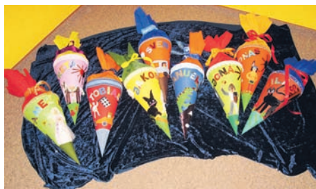
Schultüten der Schulanfänger aus dem KiGa „Am alten Friedhof“

Unsere Sommerferien: 15.08. - 05.09.2011