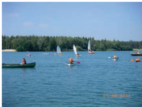
alle auf dem Wasser

Am Montag, den 1. August fand am Baggersee bei optimalem Wetter der traditionelle Ferienspaß statt.