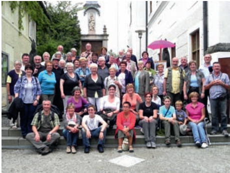
Frohsinnler am Kloster Seon