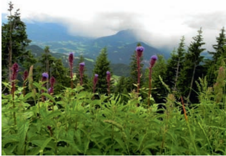
Panorama auf der Rossfeldstrasse