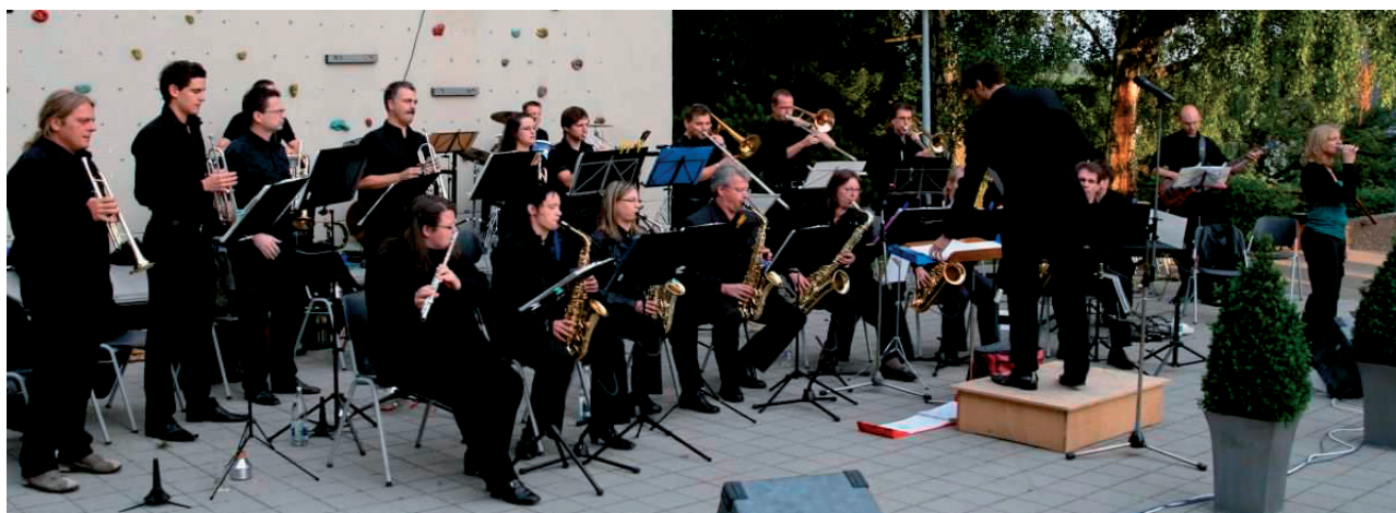
Die Big Band des Landratsamtes Karlsruhe spielt für Sie Jazz, Swing, Blues und Rock'n Roll. Sie gastiert am Sonntag, 17. Juli 2011, ab 19:30 Uhr mit einem Sommerkonzert auf der Ravensburg bei Sulzfeld.

Telefon: 07 21 / 92 110 90, info@vhs-karlsruhe-land.de