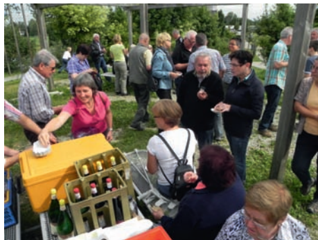
Worscht und Wein verkürzen die Anreise