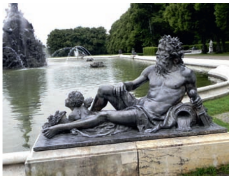
Adonis am Schloss Herrenchiemsee