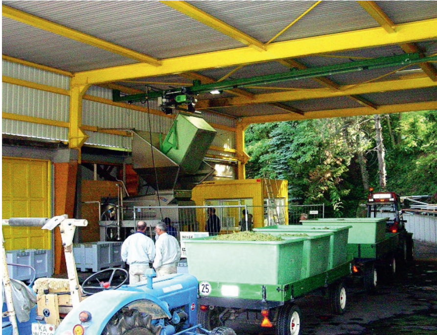
Die ersten Trauben rollen an, die Lese hat begonnen

spricht von beginnender Fäulnis. Vor allem die kompakten Trauben mit einem engen Beerenstand seien befallen, die lockerbeerigen betreffe es noch nicht. „Es gibt lockerbeerigen Spätburgunder, der kann gut und gern noch drei Wochen hängen bleiben“ meint er. Andererseits sieht er Weißburgunder und