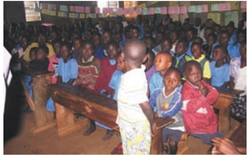
Vorschule in Kyamulibwa (Uganda)

Bitte teilen Sie uns auch mit, wenn Sie Ihr Kind in der Europäischen Schule oder in der Freien Waldorfschule angemeldet haben, bzw. anmelden wollen.