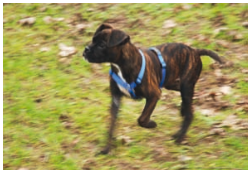
Mit fünfzehn Wochen schon voll dabei!