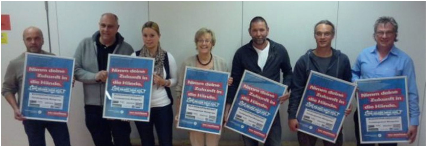
Kooperation Turmbergschule Handwerk