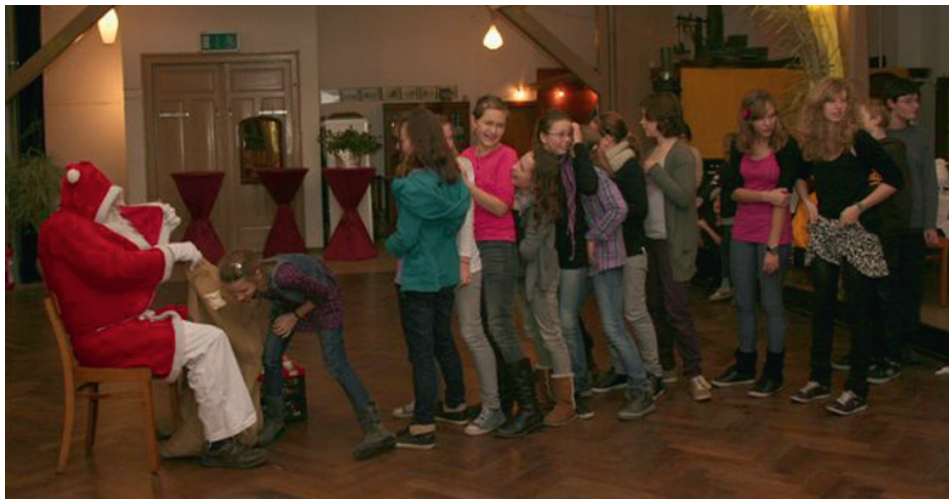
Fußballvereinigung 1906 e. V. Weingarten