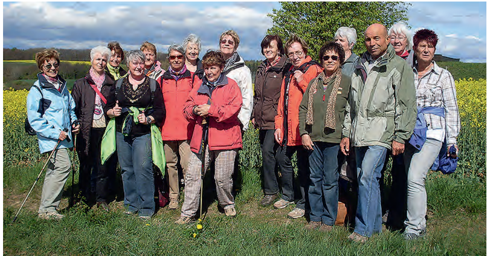
Mal Sonne, mal Regen

Weitere Informationen beim Wanderführer Horst Burtchen, Tel.: 607856 (ab 23.04.) Seniorenwanderung über Feld und Flur Über schmale Pfade und schöne Wege wanderten wir, 20 Senioren am 19.04.2012 bei wechselhaftem April-Wetter, mal Sonne mal dicke Wolken, Richtung Sallenbusch. Nach einer Stärkung im Backhaus machten wir uns auf den Heimweg. Beim Ausgangspunkt angekommen verabschiedeten wir uns: „s‘war mol widder sche!“