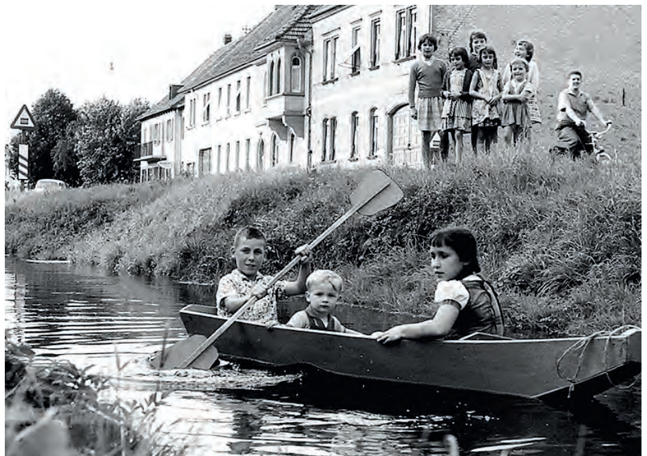
Der Walzbach und lustige Walzbachgeschichten sind ein Schwerpunkt der neuen „Weingartener Heimatblätter“ Kinder