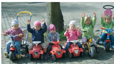
MiniClub-Kids in Aktion

Ihr Kind ist zwischen 1,5 und 3 Jahre alt und Sie hätten gerne mal wieder etwas Zeit zur eigenen Verfügung? Wir Leiterinnen vom MiniClub betreuen Ihr Kind gerne am Mo., Mi., und/oder Do. vormittags für 3 Stunden. Jede Gruppe umfasst maximal 8 Kinder, die fest angemeldet sind. Die Leiterin der Gruppe wird jeweils im Wechsel von einer Mutter unterstützt. In den großen Räumlichkeiten mit Garten kann sich ihr Kind frei bewegen und unbeschwert spielerisch und sozial entfalten. Falls wir Ihr Interesse geweckt haben, besteht die Möglichkeit zwei Schnuppertage mit ihrem Kind im MiniClub zu verbringen, um das Angebot kennenzulernen. Wir freuen uns auf Ihren Anruf (Tel: 9479390) oder schreiben Sie uns eine E-Mail unter Allerdings-Weingarten@web.de