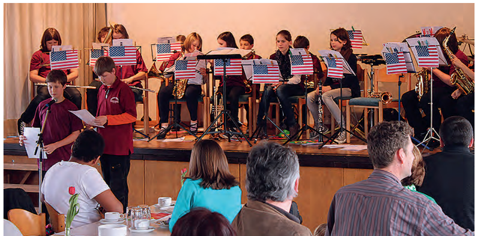
Die musikalische Reise des Schülerorchesters ging in verschiedene Länder, u.a. nach USA

ganz verbringen können. Wir freuen uns auf Ihren Besuch!