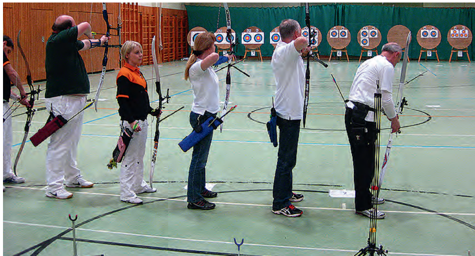
Der Wettkampf hat begonnen.

Nach der letzten Passe wurde das Turnier von allen Teilnehmern mit lautem Klatschen verabschiedet, die letzten Ergebnisse notiert und die Pfeile gezogen. Danach wurden dann die Bögen abgebaut und mit den Pfeilen wieder transportfähig verstaut.