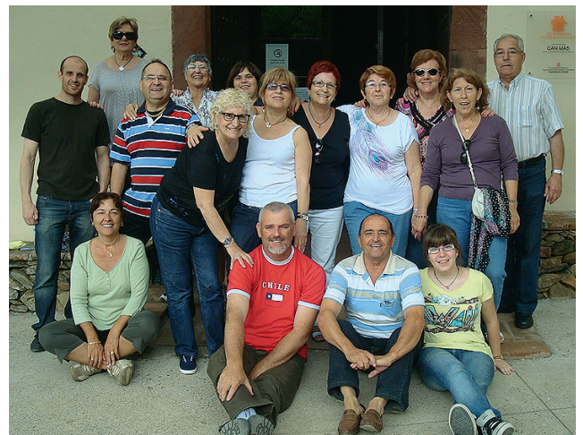
Coral Contrapunt d'Abbrera