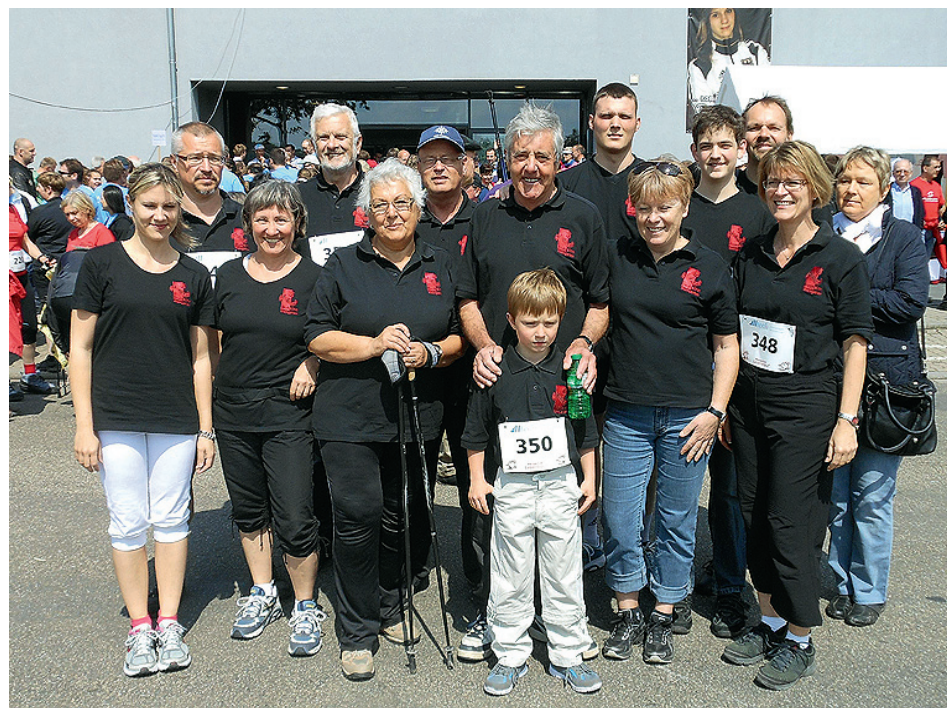
Frohsinn-Teilnehmer beim „Lebenslauf“ 2012

Beim Lebenslauf 2013 peilen wir einen einstelligen Platz in der Gesamtwertung an. hjmi