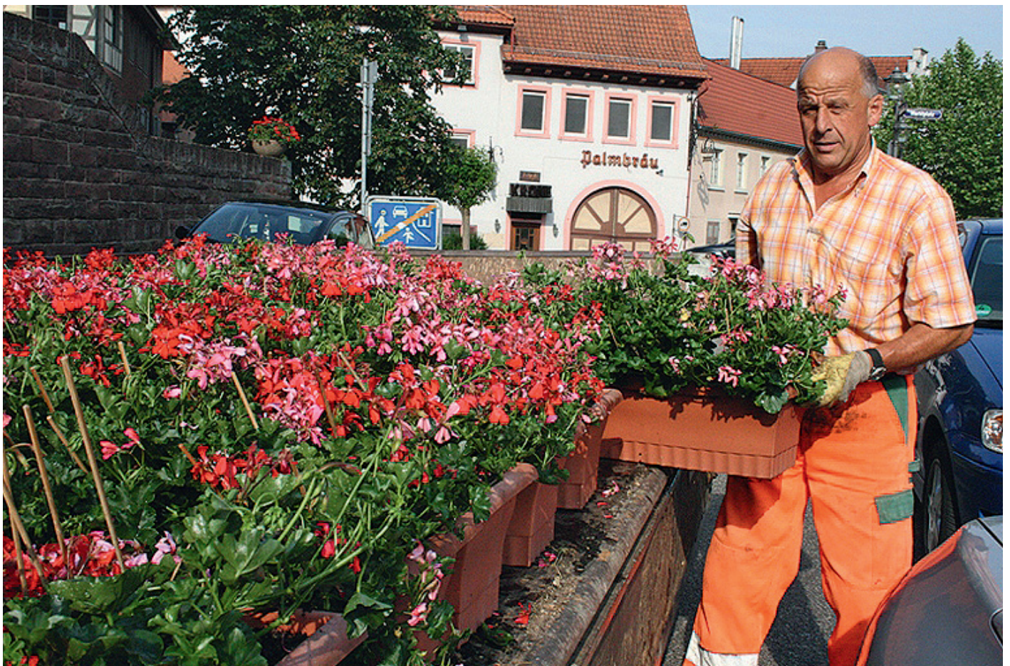
Es ist unübersehbar: Der Sommer kommt. 120 Kästen voll Geranien in rot und rosa werden den Sommer über am Walzbach blühen und Weingarten sommerlich schmücken.

die Malerei nicht fertig, aber schon deutlich erkennbar sind die Konturen des Wasserrades, der Tullabrücke und des Weingartener Wahrzeichens, die drei Türme. Als Blickfang springt die rote Weintraube ins Auge: Symbol für Freude und Lebensart im Weindorf. Freuen wir uns auf mehr! Wir begleiten die Malerin auch noch in der nächsten Ausgabe.