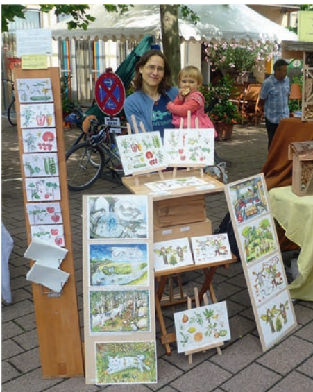
Stand am Kreativmarkt