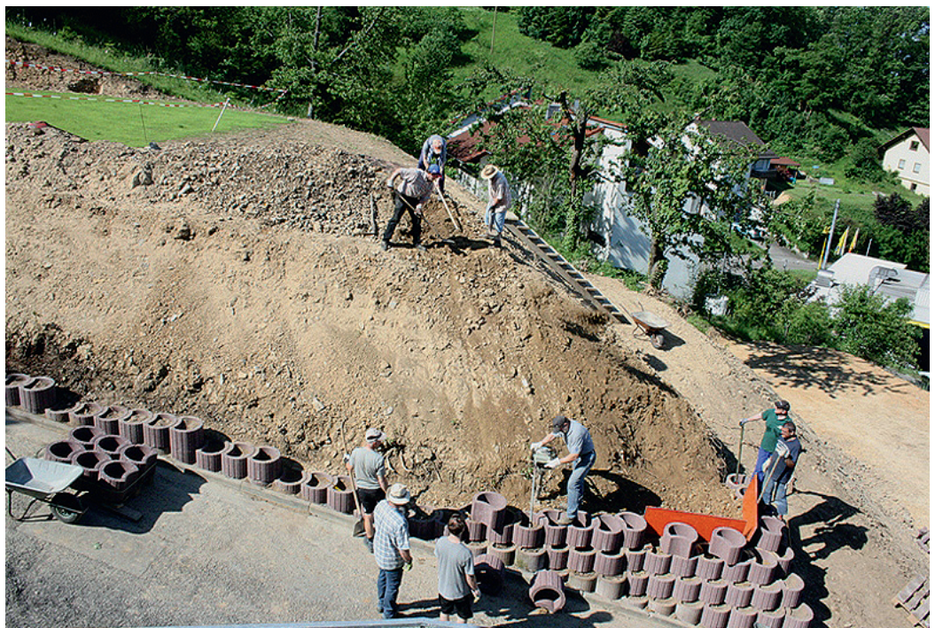
In Eigenarbeit setzen die Mitglieder des Schützenvereins Pflanzringe, um die Böschung zu stabilisieren

Momentan ist das Plateau noch über eine Behelfstreppe zu erreichen, vorgesehen ist, von Straßenniveau aus einen Weg im Bogen um den Hang herum zu führen, der seniorengerecht ausgebaut wird. Die Vorstandschaft rechnet mit der Fertigstellung bis Juli - August diesen Jahres.