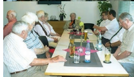
Ehrenmitgliedertreffen am Pfingstmontag