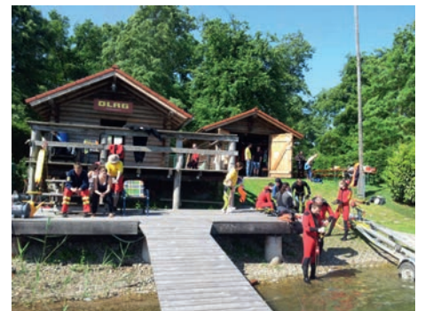
DLRG Wache Weingarten

te der Patient an den Rettungsdienst übergeben und vom Notarzt versorgt und ins Krankenhaus transportiert werden.