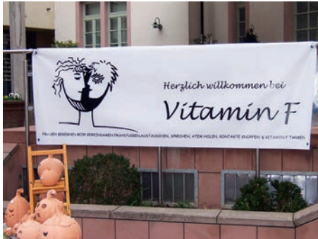
Vitamin F-Banner am Kreativmarkt

13.10.12: 47. Frauenfrühstück - 20jähriges Jubiläum von Vitamin F mit der Frauenkabarett-gruppe „Marie & Sophie“ aus Königsbach SuBü