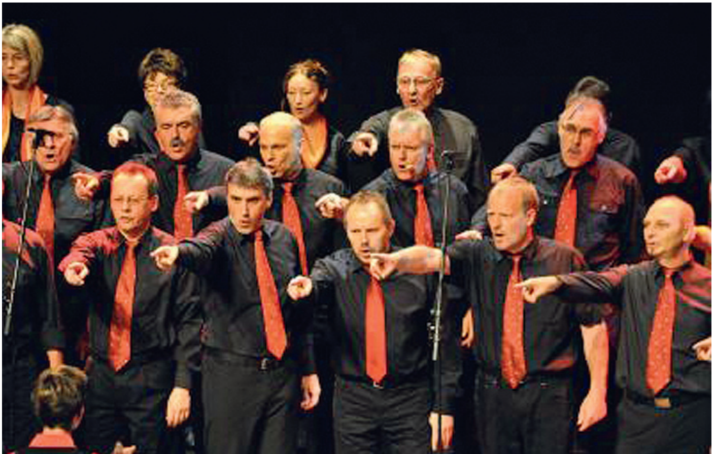
G'sang for fun