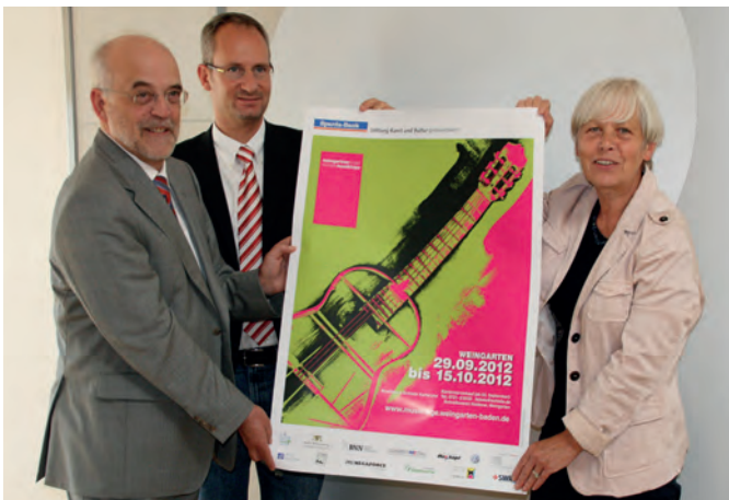
Eine „geröntgte Gitarre“ weist auf die Weingartener Musiktage hin, die am 29. September mit dem Eröffnungskonzert im Gewächshaus Stärk beginnen