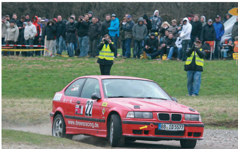
Gleich mehrere MSC'ler starten am 1.9. bei der Rallye Calw!

im ersten Moment als einfacher Fahrfehler aussah und sich aber keiner so Recht vorstellen konnte, erwies sich bei der Untersuchung durch das Team nach dem Parc Ferme als Bremsversagen. Auch wenn dadurch die Sensation des ersten Gesamtsiegs eines Amateurs in der ADAC GT Masters dahin war und auch wertvolle Punkte in der Mei-