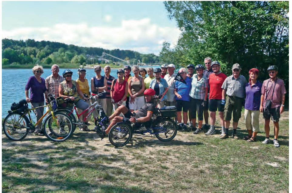
Am Liedolsheimer Baggersee

Zum Radeln trafen sich am 25.08.2012 um 10 Uhr am Weingartner Bahnhof 23 Rad-