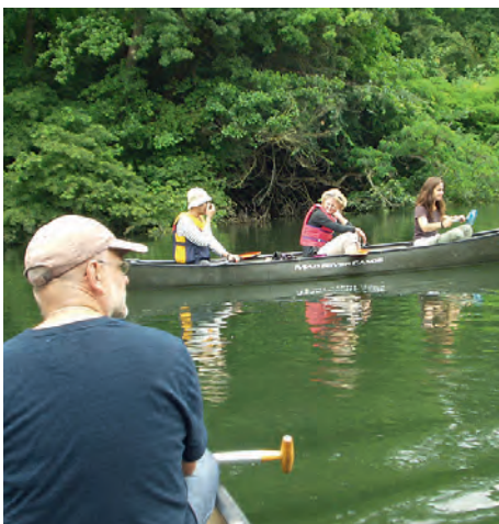
Fahrt auf dem Lingenfelder Altrhein

Behinderten- und Rehabilitations- sportverein Weingarten e. V.