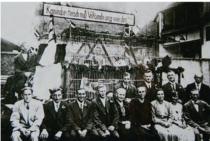
Nach dem Zweiten Weltkrieg stieg die Mitgliederzahl im Kaninchen- und Geflügelzuchtverein stetig an. Das Foto stammt aus der Zeit um 1950.