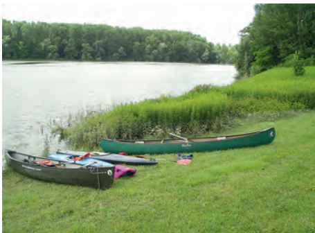
Rast am „Schäfersee“

Weiter steht noch die Einladung der Kehler Paddlergilde am Wochenende 21.-23.09. an. Wir wollen am Samstag die Ill paddeln und am Abend an der Lampionfahrt durch „Petite France“ in Strassburg teilnehmen. Anschließend findet ein Paddlerhock mit Übernachtung im/beim Bootshaus statt. Am Sonntag soll dann das Groschenwasser in der Nähe gepaddelt werden.