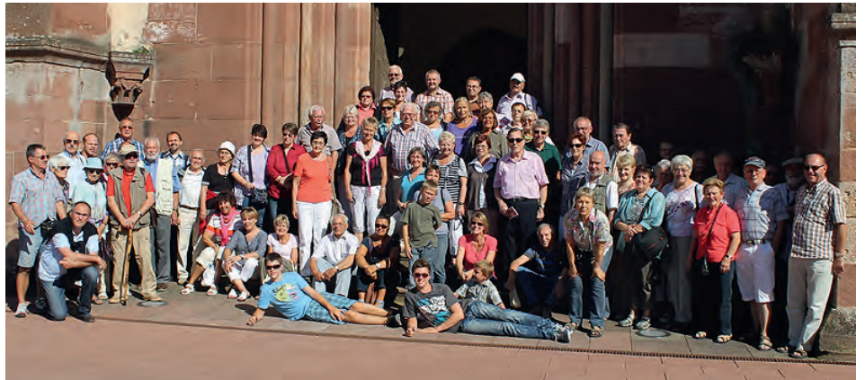
Die Frohsinn-Ausflügler vor der Klosterkirche Bronnbach.

Blasorchester: jeden Dienstag ab 20:00 Uhr Nach den Vor- und Nachbereitungen für Hitparade und Weinwandertag gönnen wir uns eine Verschnaufspause und starten am 02.10. wieder mit den Proben.