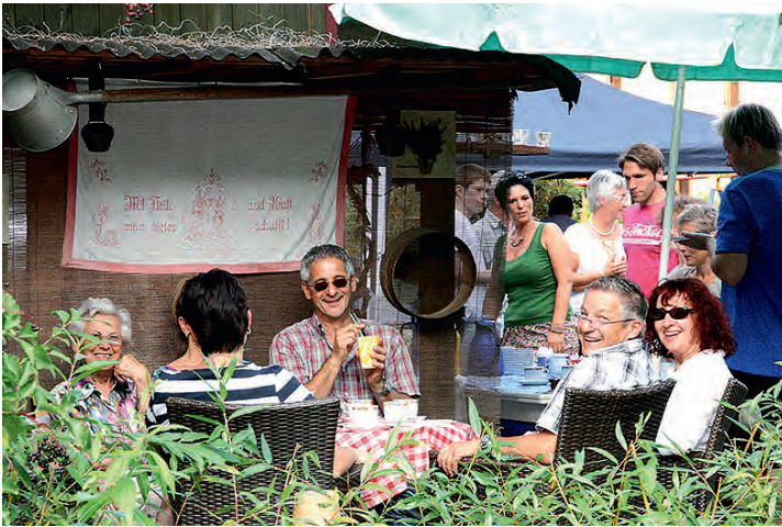
Bei traumhaftem Spätsommerwetter herrschte ein großer Besucherandrang im Café am Bach

Erneut hatten am Sonntagnachmittag zahlreiche Spaziergänger den Weg zum gut ausgeschilderten Café am Bach gefunden. Aber nicht nur Weingartener waren da, auch „Auswärtige“, die zufällig vorbeikamen und diesem einladenden Ambiente nicht widerstehen konnten.