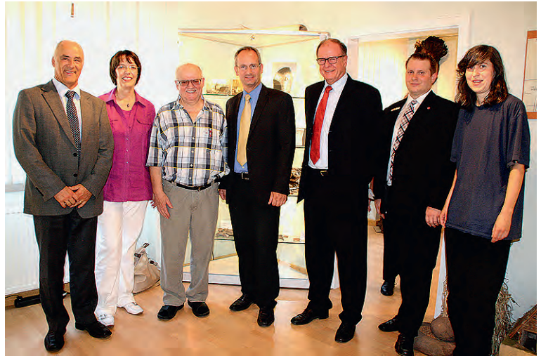
Vertreter der Sparkasse Karlsruhe Ettlingen übergaben Ende Juli die sechs gesponserten Vitrinen an den Bürger- und Heimatverein