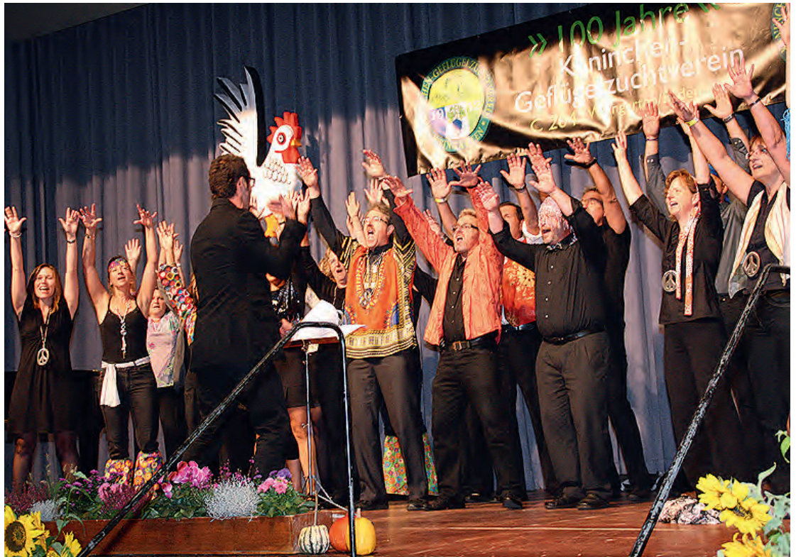
Swinging Voices „einer von vielen Gratulanten“ mit schwungvollem Gastauftritt