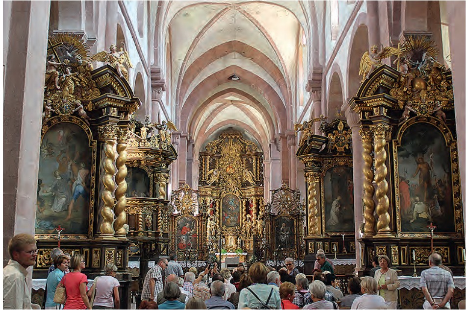
Besichtigung des Klosters Bronnbach (Gesangverein Frohsinn Weingarten)

Es ist noch Zeit, mitzumachen - jetzt gehen die Chor-Proben des Gesangvereins Frohsinn Weingarten 1886 e.V. weiter. Auf dem vorläufigen Programm für die MUSIKALISCHE SOMMERNACHT am 22. Juni 2013 stehen Schlager, Musicals und Filmmusiken. Im kommenden Sommer werden wir zum Beispiel Gesangsstücke von Udo Jürgens und ABBA, aus dem Musical „Les Misérables“ und aus dem Film „Wie im Himmel“ aufführen.