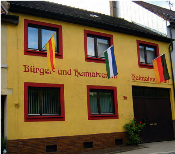
Das neue Heimatmuseum des Bürger- und Heimatvereins in der Durlacher Straße 30 wird am Sonntag, 30. September, mit einem Tag der offenen Tür von 11 bis 18 Uhr eröffnet

Der Bürger- und Heimatverein Weingarten hat jetzt ein seit Jahren verfolgtes Ziel erreicht: Nach einer umfangreichen Renovierung, die zum großen Teil in Eigenarbeit erfolgte, und mit Hilfe bei der Einrichtung seitens der Kulturstiftung der Sparkasse Karlsruhe Ettlingen, wird am Sonntag, 30. September, der erste Teil des neuen Heimatmuseums in der Durlacher Straße 30 mit einem „Tag der offenen Tür“ von 11 Uhr bis 18 Uhr für die Bevölkerung eröffnet.