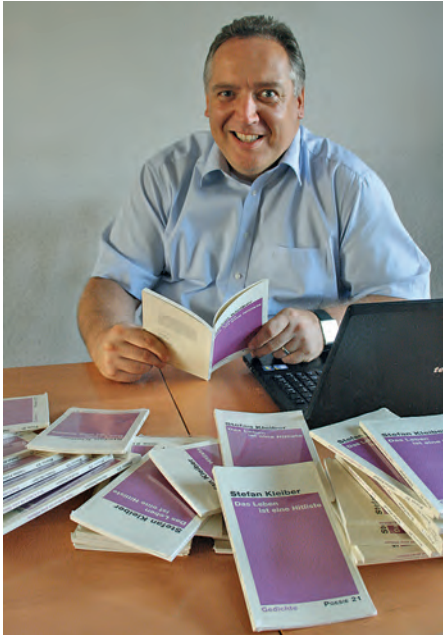
„Das Leben ist eine Hitliste“ ist ab sofort in der Buchhandlung „Bücherwurm“ erhältlich