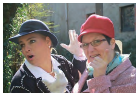
Frauenkabarett „Marie & Sophie“

Falls Sie trotz Reservierung verhindert sein sollten, so sagen Sie uns Bescheid. Dann haben andere Frauen die Möglichkeit, sich mit Vitamin F („F“ bedeutet: fantastisches, fröhliches & freudiges Frühstück mit fabelhaften, fantasievollen Frauen und Freundinnen) aufzuladen. Bitte seien Sie pünktlich. Reservierte Plätze verfallen um 8.50 Uhr. SuBü