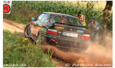
Spektakuläre Drifts auf dem Weg zum Gruppen- und Klassensieg

Durch den großen Abstand zum Klassensiege schielte die Besatzung schon