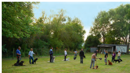
Gemeinsam klappt's einfach besser