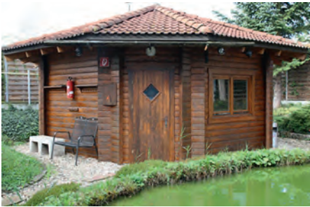
Die Sauna am Walzbachbad

Mit Beginn von Herbst und Winter kommt auch wieder die Zeit, in die Sauna zu gehen. Die Sauna kommt aus Finnland, wo sie ihren Ursprung in einer Holzhütte hatte, die auch mit Holz beheizt wurde, daher auch der Ausdruck „Blockhaus-Sauna“. In Deutschland haben allerdings längst moderne Gas- oder Elektroöfen Einzug gehalten und meist ist eine Sauna einem öffentlichen Schwimmbad oder einem Fitnessstudio angeschlossen.