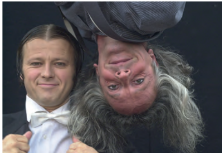
Gogol & Mäx