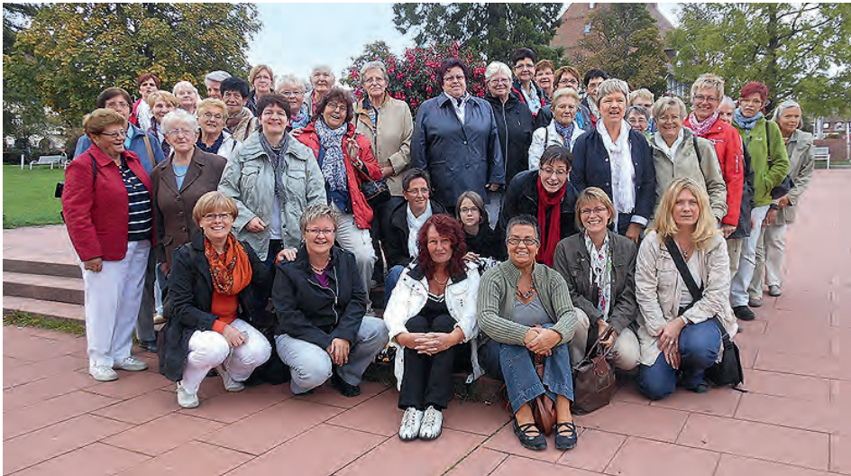
Die Ausflüglerinnen des Gesangsvereins Frohsinn.