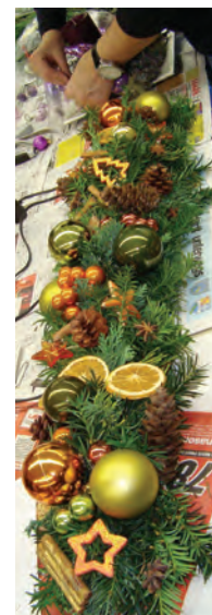
Impressionen aus unseren Floristikkursen vom Advent 2011.

In den drei Kursen Schöner Schmuck für Weihnachten gibt es noch frei Plätze.