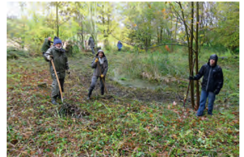
nachher, die Teiche sind wieder zu sehen