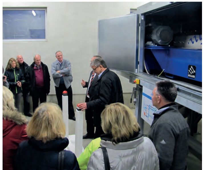
Gemeinderat und Amtsleiter begutachten die neue Anlage

Gemessen an der bisherigen Verfahrensweise werde sich die Anlage trotz der hohen Anschaffungskosten von 440.000 € binnen von sechs Jahren amortisiert haben. Die Einsparung bei den Entsorgungskosten für den Klärschlamm beträgt ca. 75 TEUR jährlich wovon ab sofort 42 000 Euro - nach Berücksichtigung von Abschreibungen und Zinsen - das Ergebnis des Zweckverbands verbessern.