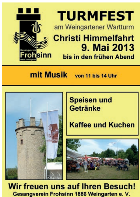
Einladung zum Turmfest des GV Frohsinn am 9. Mai 2013

Donnerstag, 9. Mai 2013, Christi Himmelfahrt: Turmfest am Weingartener Warturm mit Essen und Getränken bis zum frühen Abend und Musik von 11 bis 14 Uhr.