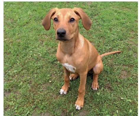
Amira freut sich auf weitere Spielgefährten in der Welpenschule

Zum Training treffen wir uns immer samstags auf unserem Platz in der Breitwiese: 17.15 - 18.00 Welpenschule 18.00 - 19.00 Junghunde und Fortgeschrittene Wir freuen uns immer über Interessenten mit Hunden jeder Art. Einfach mal vorbeischaun! Auf unserer Webseite www.hundefreunde-weingarten.de finden sich weitere Informationen und Fotos vom Training. Für Fragen steht Jürgen Stiller, 07257/931422, zur Verfügung.