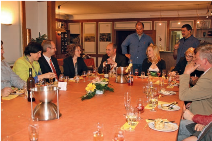
Jungweinprobe in der Winzergenossenschaft: Vier Weine wurden vom Badischen Weinbauverband mit Gold ausgezeichnet.

Vier Goldmedaillen haben sie schon und weitere sind in Aussicht: Die Weine der Winzergenossenschaft Weingarten des Jahrgangs 2012 sind in Topform. Mit Stolz hat die Vorstandschaft der WG die Bürgermeister und Ortsvorsteher ihrer Mitgliedsgemeinden eingeladen, fünf vielversprechende Jungweine zu verkosten.