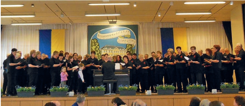
Auftritt des GV Frohsinn in Friedrichstal am 21. April 2013

oder per E-Mail an frohsinn-weingarten@web.de eingereicht werden. Der Vorstand bittet um zahlreiche Teilnahme.