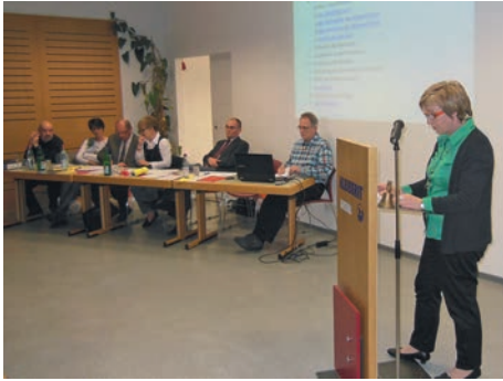
Der Vorstand des GV Frohsinn bei der Jahreshauptversammlung 2013