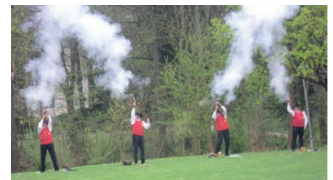
Die Böllerschützen beenden mit einem Salt den Landesschützentag