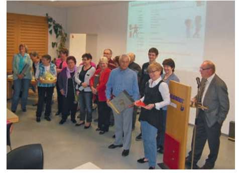
Die „lückenlosen Probenbesucher“ des GV Frohsinn bei der Jahreshauptversammlung 2013