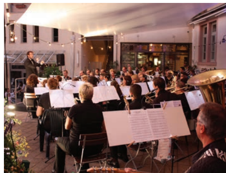
Eindrücke vom Sommernachtskonzert 2011

Wer nach dem Sommernachtskonzert immer noch nicht genug von uns hat: Wir spielen am Sonntag, den 14. Juli um 11:30 - 13:30 Uhr beim Musikfest in Büchenau und freuen uns wie immer über Unterstützung aus der Heimat!