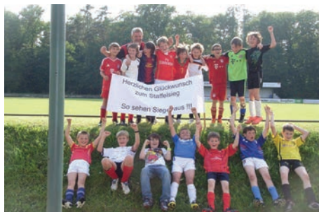
zuerst wurde die Staffelmeisterschaft eingefahren ...