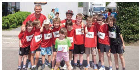
danach war das Team beim Lebenslauf am Sart, Jungs ihr seid spitze!