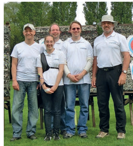
Die Teilnehmer des Siebedinger Bogenturniers