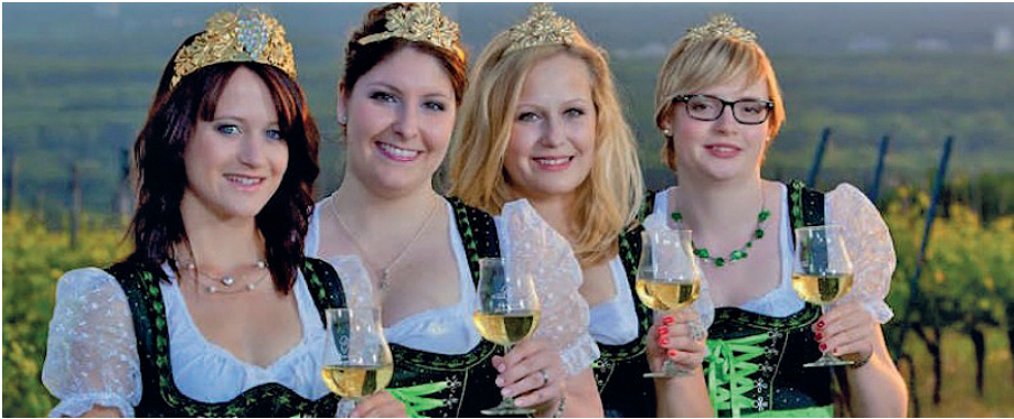
Seien Sie dabei beim Abschied der amtierenden und Begrüssung der künftigen Weinhoheiten am 20. Juli

Alle Einwohner sind herzlich eingeladen, am 20. und 21. Juli das Wein- und Straßenfest zu besuchen