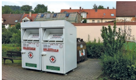
Kleidercontainer des DRK Weingarten (Baden)

6 - 13 Jahre von 18:30 bis 19:30 Uhr ab 14 Jahre von 19:15 bis 21:00 Uhr