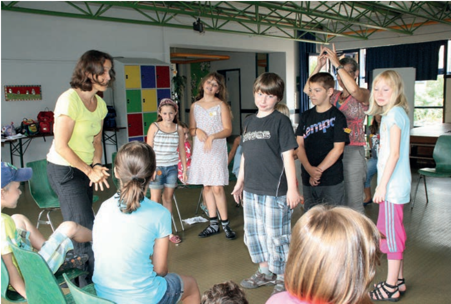
Der König mit der Krone steigt in die Zeitmaschine