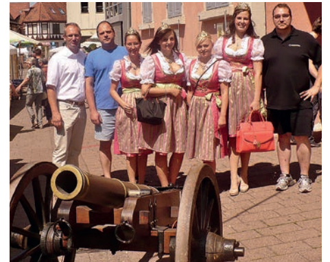
Die Weinhoheiten und BM Bänzinger bei den Schützen

In diesem Jahr hatte es der Wettergott besonders gut gemeint. Bei tropischen Temperaturen veranstaltete die Gemeinde Weingarten ihr Wein- und Straßenfest. Der Schützenverein Weingarten, schon seit Jahren fester Bestandteil, eröffnete mit einem Böllerschuss das Fest. Bei leckerem Zwiebelsteak, Pollofino