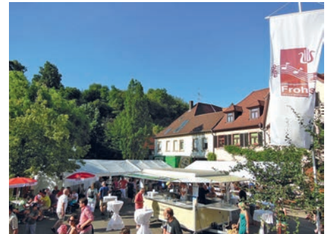
Die Stände des GV Frohsinn beim Wein- und Straßenfest

Drei große Aktivitäten hatte der Gesangverein Frohsinn Weingarten schon in diesem Jahr: Das Turmfest an Christi Himmelfahrt Anfang Mai, die „Musikalische