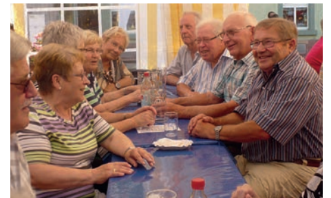
Beste Laune bei den Besuchern unseres Feststandes „Pulverfässer“