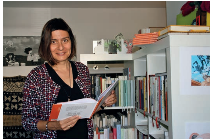
Frau Hanel schreibt nebenberuflich Kinderbücher und wohnt seit einigen Jahren in Weingarten

„Linn liebte den Wald. Nur sie und die Bäume und das Rascheln im Laub und die Sonnenstrahlen.“ Das Buch enthält zwei Geschichten ähnlicher Thematik. In beiden geht es ums Verlaufen und um eine glückliche und hilfreiche Begegnung. Im Nachwort berichtet die Autorin von eigenen Erlebnissen und gibt somit dem Buch eine persönliche, authentische Note. Illustriert werden „Linns Abenteuer“ wiederum von Octavia Hanel. Ihre Skizzen sind ein wesentlicher Teil des Buches, denn sie zeigen meisterhaft die Proportionen und stellen das Wichtige in