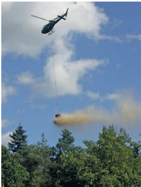
Helikopter bei der Ausbringung des Kalkmaterials

Für Rückfragen steht das Forstamt unter Tel. 0721/9366577 zur Verfügung. Informationen zur Bodenschutzkalkung sind ab Freitag, 27. September, zusätzlich auch auf der Internetseite des Landratsamtes unter www.landkreis-karlsruhe.de > Bürgerservice > Ämter und Ansprechpartner > Forstamt abrufbar.