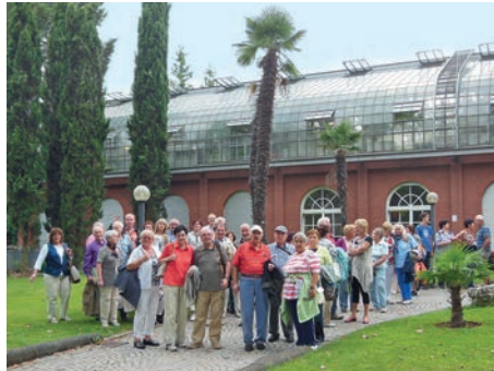
Ausflug des GV Frohsinn zum Frankfurter Palmengarten