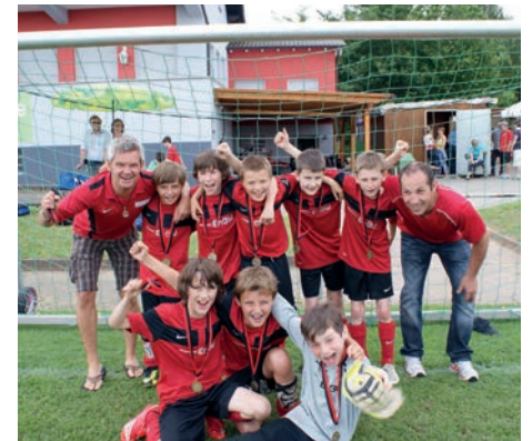
Die E2 am 07.07.2013 in Spielberg

Im letzten Turnier vor den Ferien haben sich die E2-Junioren der FVgg mit einem 1. Platz von der Saison 2012/2013 verabschiedet. Bei schönem Wetter, man sieht die Jungs mit der Sonne um die Wette strahlen, wurden nach einem erfolgreichen Turnierverlauf ohne Niederlage die Medaillen in Empfang genommen. Jetzt geht's mit neuem Schwung in der E1 in die neue Saison.