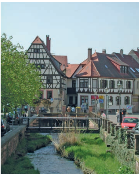
Lernen Sie die schönen Ecken von Weingarten kennen!