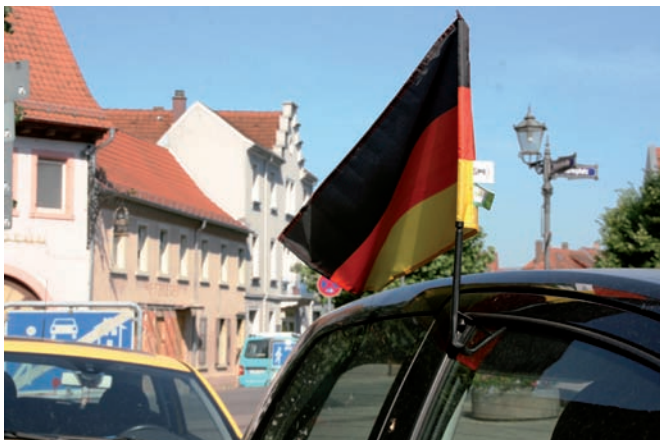
Die WM ist auch ein Stück weit eine große Party