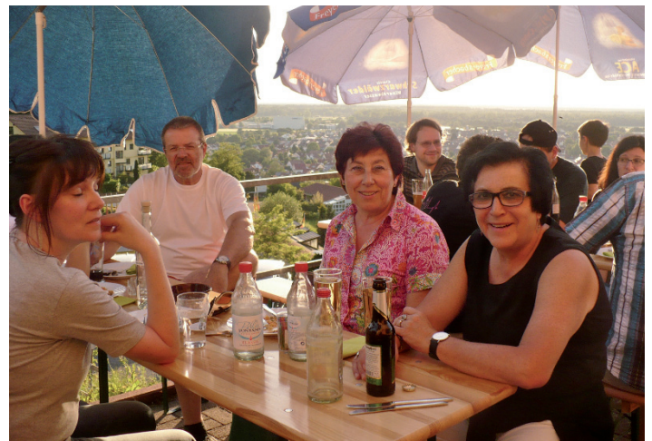
Zufriedene Gesichter bei den Mitgliedern