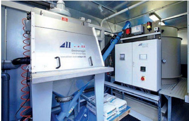
Anlage zur Phosphatrückgewinnung, eingebaut in einen Container (Innenansicht)

Die GreenTec Awards sind Europas größter Umwelt- und Wirtschaftspreis und werden einmal jährlich für Umweltengagement und grüne Umwelttechnologien verliehen. Für die Kategorie Recycling & Ressourcen hat die Jury Projekte ausgewählt, bei denen wertvolle Abfälle möglichst vollständig in Sekundärrohstoffe umgewandelt werden. Der Beitrag von Alltech ist eine