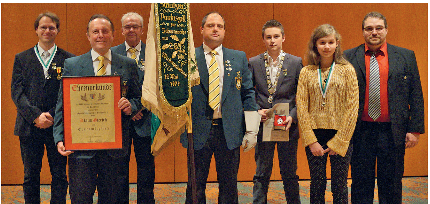
Die Sieger und Geehrten beim Kreisschützenabend