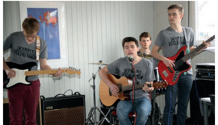
Die Jugendband „Cellar Society“ aus Weingarten

Letztendlich wünschte er Deutschland „einen Sozialstaat, der fördert und fordert und nicht auf die Erhaltung des Existenzminimums reduziert wird“. Der Ortsvereinsvorsitzende Erich Höllmüller bezeichnete mit dem Blick auf die bevorstehende Kommunalwahl die Kommunalpolitik als die Ebene, in der die Grundlage der Gestaltung des unmittelbaren Lebensraums geschaffen werde, was weitsichtige Vorausschau erfordere. Die Weingartner SPD wünsche eine Politik, die Gemeinschaft stärke und Identität stifte. Die Einrichtung der Gemeinschaftsschule sei ein großer Erfolg der grün-roten Landesregierung. Die Mitgliederbefragung zur Koalitionsvereinbarung habe auch im Weingartner Ortsverein hitzige Diskussionen ausgelöst. Aber der Koalitionsvertrag trage die Handschrift der SPD, darum habe er Zustimmung gefunden. Erkennbar sei diese Handschrift vor allem in den Vorschlägen zur Rente: „Mütterrente“, „Rente mit 63“ und „Erwerbsminderungsrente“. Die Jugendband „Cellar Society“ aus Weingarten übernahm die musikalische Gestaltung des Nachmittags.