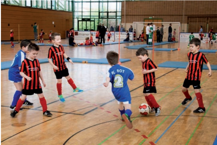
Bambinis in Neudorf gegen den FC Rot

Wie zu Beginn erwähnt wechseln die Jahrgänge 2008 zu Ende März gemeinsam mit mir in die F3 Jugend, womit auch bereits die Spiel-tage ab dem 21.03.2015 starten.