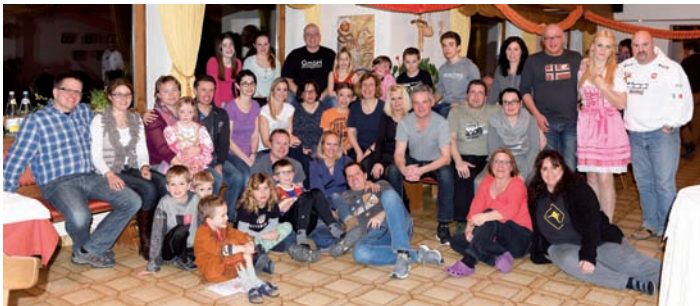
Unsere Teilnehmer der Familienfahrt

In den Faschingsferien waren wieder zahlreiche skibegeisterte Familien bei unserer Familienfahrt am Kronplatz dabei. Eine Woche Traumwetter und bestens präparierte Pisten machten diese Woche wieder zu einem absoluten Highlight. Einen netten Bericht und weitere Bilder findet Ihr auf unserer Homepage www.skiclubstabil.de