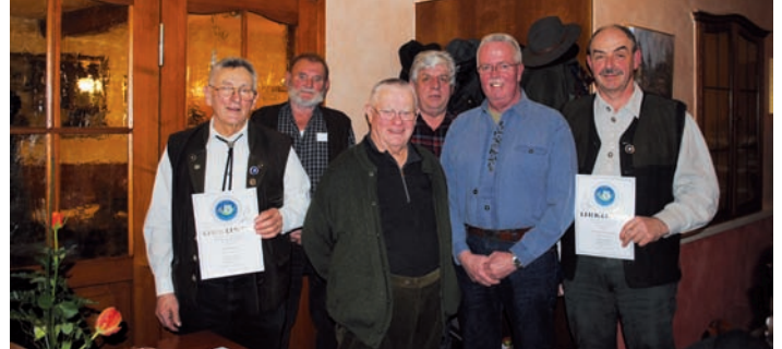
Die Pioniere der Jagdhornbläser Waidmannsheil Weingarten e.V.