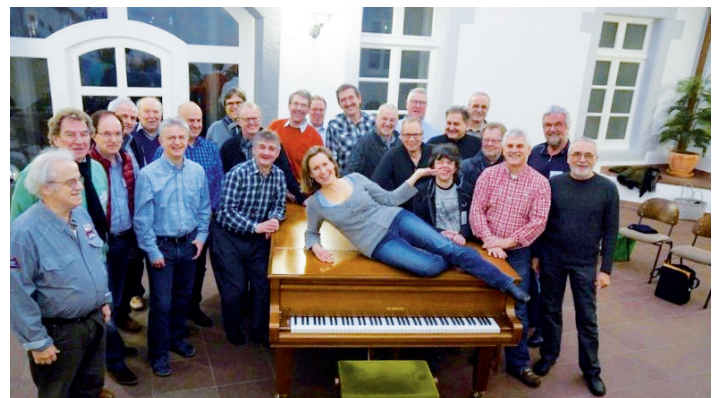
Der Chor mit Stimmbildnerin im Probenraum

Mit Sonne im Herzen haben wir unsere musikalische Reise nach Jamaika fortgesetzt, uns auf den bevorstehenden Abend mit „was wollen wir trinken“ vorbereitet und mit dem Mann im Mond schon einmal die Sterne am Himmel glänzen lassen.