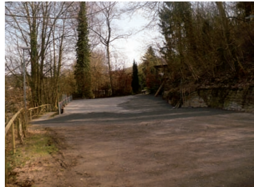
Jetzt bessere Parkplatzsituation am oberen Vogelpark.

Sobald die Spielgeräte aufgebaut und freigegeben sind werden an gleicher Stelle berichten und bitten bis dahin noch um etwas Geduld.