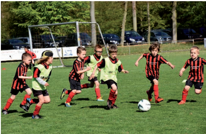
F2 und F3 in Aktion