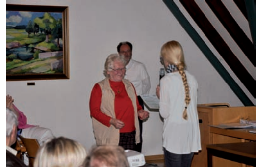
Ehrung der Teilnehmer der Fortbildung