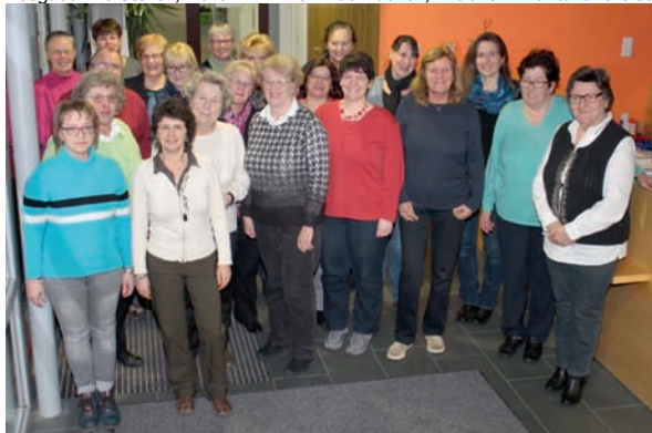
Einige der Bürgerschaftlich Tätigen und Fachkräfte der „Vergissmeinnicht-Arbeit“ der Kirchlichen Sozialstation Stutensee- Weingarten.

Wir wissen, dass es sehr schwer ist, Hilfe anzunehmen und zuzulassen. Man braucht dafür Mut und Vertrauen. Indem wir uns und unsere Arbeit in den nächsten Ausgaben vorstellen, wollen wir ihnen Mut machen, mit uns in Kontakt zu treten.