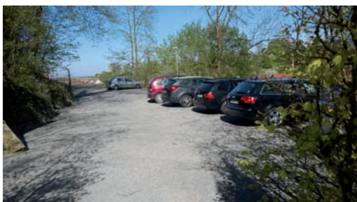
Erweiterter Parkplatz am oberen Vogelpark.

Ja, wir haben es getan. Der Kinderspielplatz am Eingang des oberen Vogelparks musste einem größeren Parkplatz weichen. Wer die Zufahrt zum Vogelpark kennt, der weiß, dass die Parkplatzsitua-