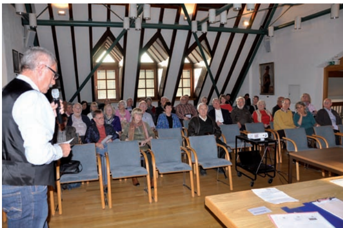
Mitgliederversammlung im Turmzimmer