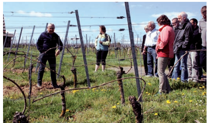
Beim Anbinden gibt es viele Erziehungsstile. Bei uns ist die Drahtrahmenerziehung in Bogenform gebräuchlich.

ihrem Parfum. Aber plötzlich duftet ganz Karlsruhe danach, dann finden Sie sie nicht mehr.“ Die Methode zeige seit Jahren Erfolg, darum seien keine Insektizide mehr im Einsatz. Ein weiteres Thema war die Unkrautbekämpfung: Auf kleineren Flächen sei Hacken die beste Methode, sagte er, für größere Flächen gebe es Maschinen oder Herbizide. „Und Wühlmäuse?“ deutete einer auf die zahlreichen Löcher. „Kein Problem“, erwiderte der Experte, „dafür haben wir hier reichlich Bussarde und Milane“.