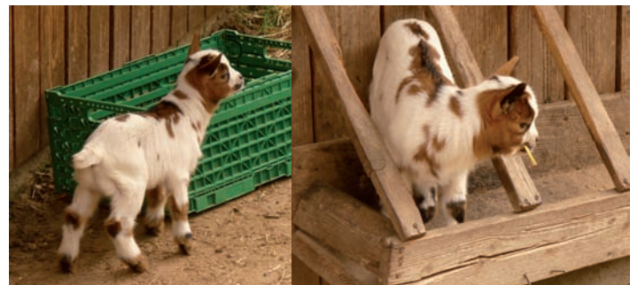
Neugierig erkundet das Zicklein sein Gehege...

Jetzt wartet es sehnsüchtig auf die anderen Parkbewohner. Seine Eltern haben ihm gesagt, dass es für den Ara Coco und die Kanarienvögel noch zu kalt ist und sie sich noch im Winterquartier aufhalten müssen. Doch es kann nicht mehr lange dauern, es wird bereits wärmer und schon bald dürfen auch sie in ihre Sommerresidenzen umziehen. Bis dahin freut das Zicklein sich auf euren Besuch und mit etwas Glück lässt es sich auch streicheln.