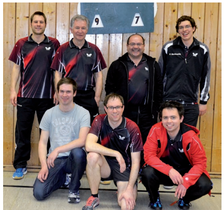
Die 3. Herrenmannschaft steigt auf