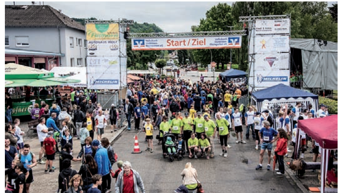
Vorbereitungen vor dem Startschuss

Am vergangenen Samstag haben sich 1.061 Läufer für den Start zum 10. Weingartner Lebenslauf zugunsten von Leukämie- und Tumormerpatienten angemeldet. Zusammen liefen sie 8.453 Runden. Das Spendenergebnis, sowie die Platzierungen der Läufer in den ein-