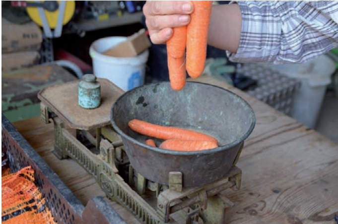
Unterstützung bei der Gemüse-Ausgabe gesucht!