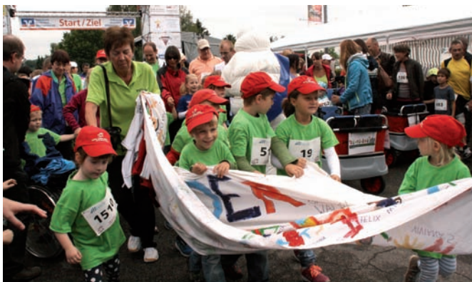
Die Kinder des Kindergartens „Waldbrücke“ bilden nach dem Start die Spitze am langen Pulk der Läufer

ben die stärkste Gruppe bilden. Darum haben wir dieses Mal nicht groß Werbung gemacht und bleiben unter 100“, berichtete Gerhard Schmitt von der Neupostolischen Kirche, dessen Gruppe in 2014 mit