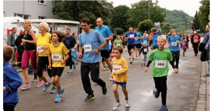
Trotz des kühlen Wetters dürften genauso viele Läufer am Start gewesen sein. Zuschauer waren es vielleicht ein paar weniger.

ben die stärkste Gruppe bilden. Darum haben wir dieses Mal nicht groß Werbung gemacht und bleiben unter 100“, berichtete Gerhard Schmitt von der Neupostolischen Kirche, dessen Gruppe in 2014 mit