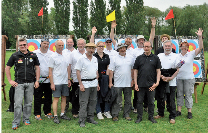
Die Teilnehmer vom 4. Vatertagsturnier in Siebeldingen

Mit sage und schreibe 15 Startern waren die Weingartner Bogenschützen mit großem Abstand die stärkste Mannschaft des 85-köpfigen Starterfeldes. Die Veranstalter hatten sich dieses Jahr etwas Neues einfallen lassen. Gegenüber dem vorjährigen Austragungsmodus mit verschiedenen Distanzen mussten in diesem Jahr 3 x 30 Pfeile über 30 m verschossen werden. Da gerieten einige, wegen der vielen Pfeile im Turniermodus verschossen, schon an ihre Grenzen.