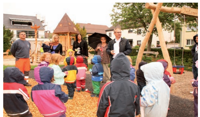
Alle Spielgeräte sind auf das Motto „Indianer“ ausgerichtet. Viel Holz gibt dem Spielplatz ein naturnahes Ambiente