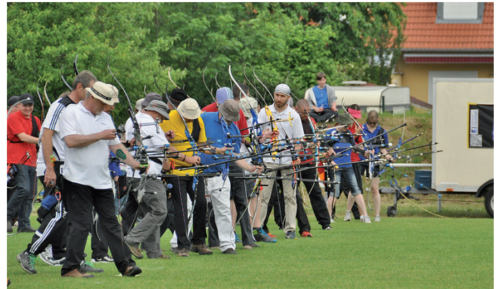
Die Bogenschützen machen sich an der Startlinie bereit.