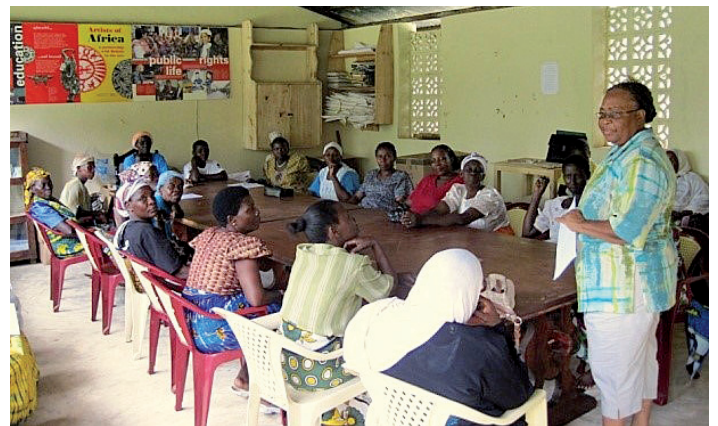
Afrikanische Frauen werden geschult