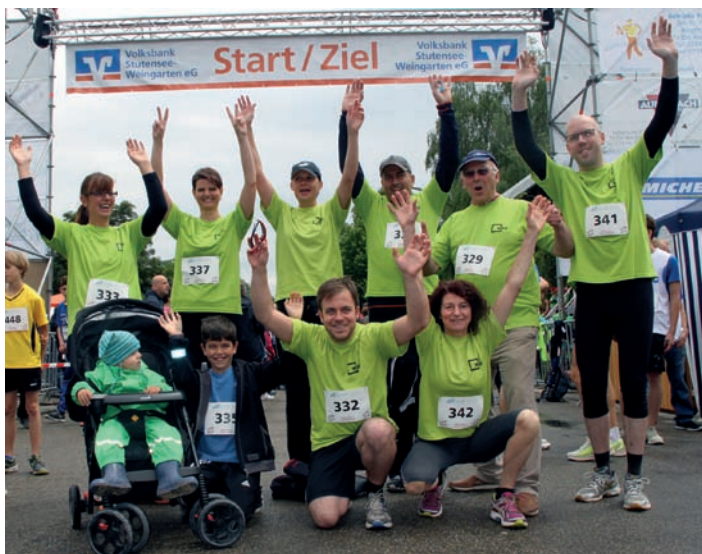
Das WBB Team beim 10. Weingartener Lebenslauf

Sie haben kommunalpolitisches Interesse und sind an einer Mitarbeit interessiert? Informationen zur Mitarbeit, Mitgliedschaft, unserer Haupt- und Beitragssatzung finden Sie auf unserer Homepage unter der Rubrik „die WBB“. Wir freuen uns auf Ihren Kontakt!