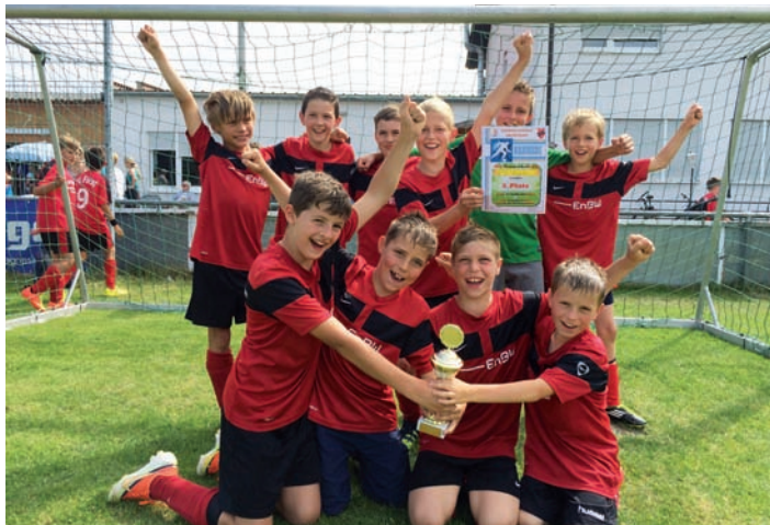
Siegemannschaft der Turmbergschule