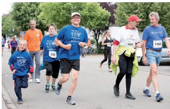
Runde um Runde für B.L.u.T. e.V.

Mit 120 Läuferinnen und Läufern und 1080 Runden hat es der TSV Weingarten nach einigen Jahren des Zweitplatzierten beim 10. Lebenslauf wieder an die Spitze der Siegerliste geschafft. Alle Abteilungen - in diesem Jahr auch ganz besonders die Handballer und Handballerinnen - liefen unter dem Motto „Laufen, walken, geben - für die Chance auf Leben!“. Die klimatischen Bedingungen für die