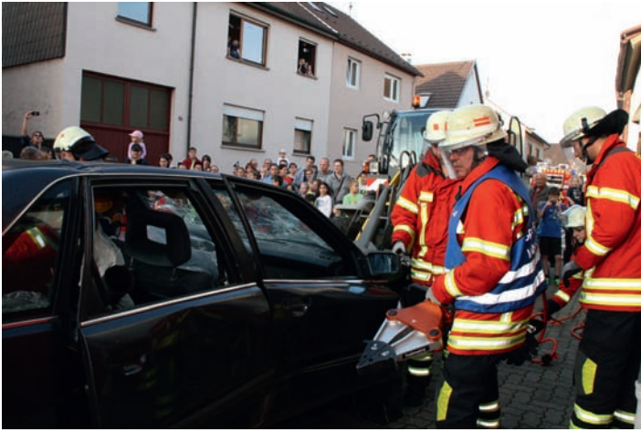
Bei den Einsätzen der Feuerwehr ist häufig schweres technisches Gerät erforderlich, wie hier der Hydraulische Spreizer.