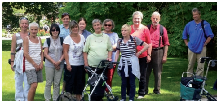
ActivePlus Orthopädiegruppe in Mainau

Daher werden wir nächstes Jahr diesen Ausflug mit Sicherheit wiederholen. Weitere Bilder und Informationen finden Sie unter www.activeplusev.de