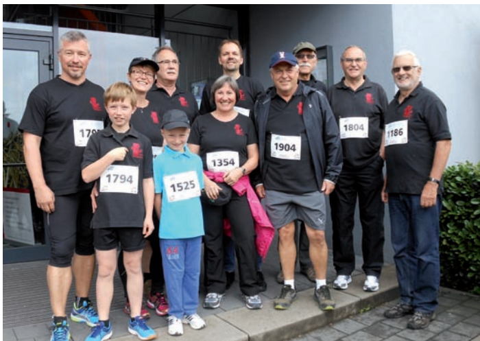
Das Laufteam des GV Frohsinn beim Lebenslauf

Mit einer kleinen, aber motivierten Mannschaft hat der GV Frohsinn auch 2015 wieder den „Lebenslauf“ von B.L.u.T.e.V. unterstützt. Die Läuferinnen und Läufer ließen sich von der wechselhaften Witterung nicht abhalten und haben zahlreiche Runden absolviert.