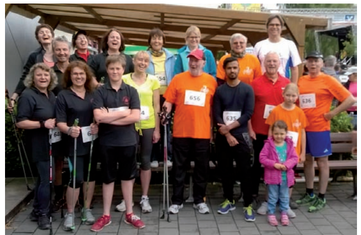
Das Team des Liederkranz vor dem Start

Auch in diesem Jahr nahmen wieder einige Läuferinnen und Läufer aus unseren Chorgruppen am Lebenslauf teil. Das Wetter war optimal und alle erreichten ihr selbstgestecktes Rundenziel. Ein gelungener Tag für alle Beteiligten! Auf dem Bild unten fehlt Amelie Ludmann.