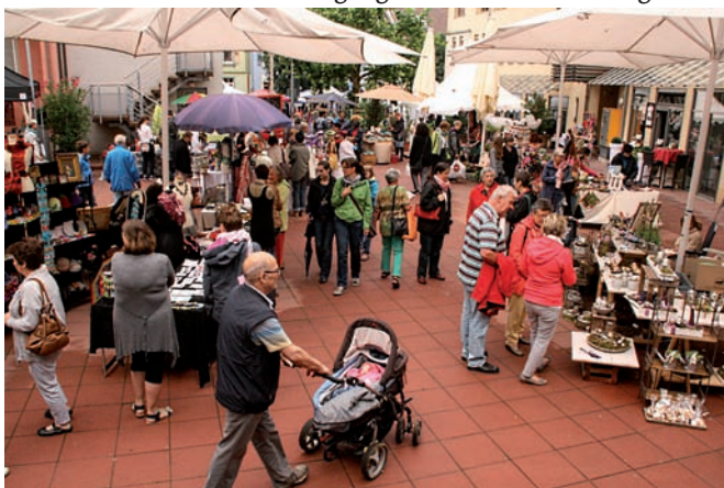
Der Kreativmarkt „Klein Montmartre“ bietet ein außergewöhnliches Spektrum von originellen, pfiffigen und hochwertigen Kunstgewerbeartikeln

Obwohl der morgendliche Blick zum Himmel nichts Gutes versprach und Punkt neun Uhr der erste Schauer niederging, wurde der Optimismus der Ausstellerinnen belohnt und keine zwei Stunden später strahlte am Samstag blauer Himmel über dem elften Kreativmarkt „Klein Montmartre“. Das bunte Treiben stand in Fülle und Vielfalt dem in den vergangenen Jahren keineswegs nach-