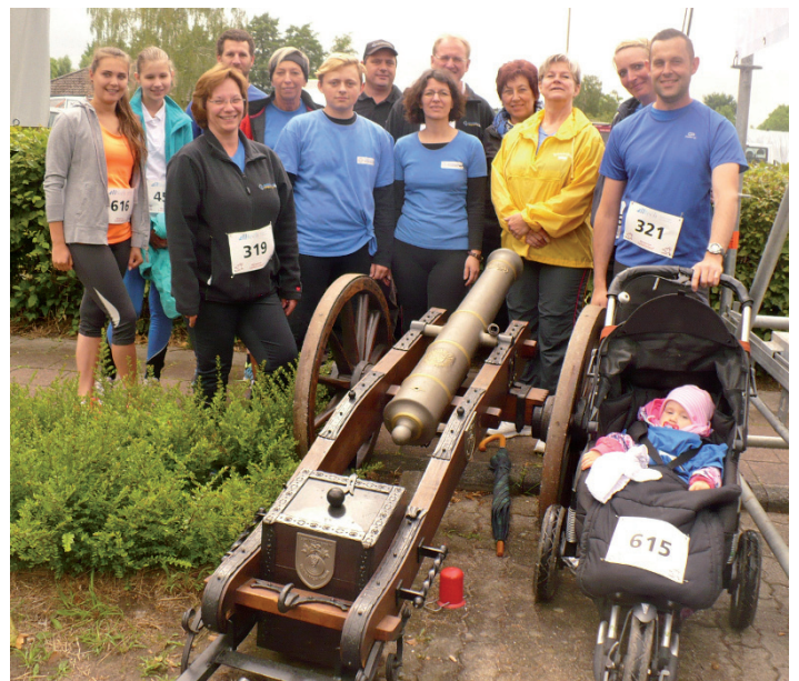
Das Schützenverein Läuferteam

Weitere Bilder finden registrierte Benutzer in unserer Fotogalerie.