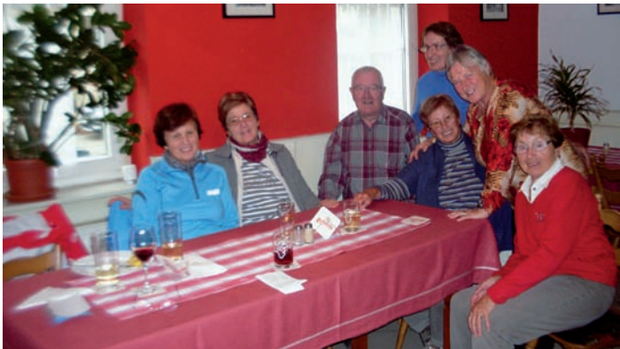
Nach der Wanderung

Nächste Seniorenwanderung ist am Donnerstag, 19. November 2015. Näheres siehe TBR.