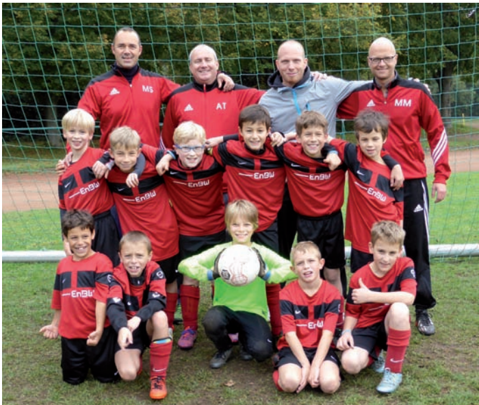
Unsere E2 am 17.10. beim Post SV

Leider konnten die Jungs auch in der 2. Hälfte die spielerische Qualität und Konzentration der ersten 20 Minuten nicht mehr abrufen und mussten somit noch zwei weitere Gegentreffer hinnehmen. Doch zuletzt stand ein verdienter 4:3 Erfolg und der Sprung auf Tabellenplatz vier.