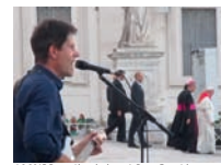
4.8.2015 Rom, Abendgebet mit Papst Franziskus