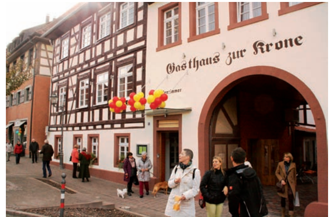
Das komplett sanierte Gasthaus „Krone“ an der Marktbrücke ist ein städtebauliches Juwel geworden und bringt badisch-feine Küche.

Topmodern sind auch die Lichtspots, die außen an der Fassade angebracht sind. Sämtliche Fenster sind als Sprossenfenster ausgebildet, am Dachstuhl über dem angrenzenden ehemaligen Metzgereigebäude wurde der künstlerische