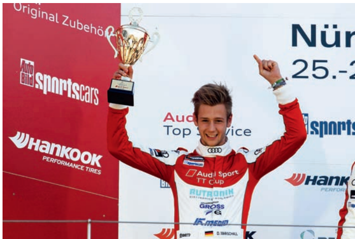
So kennen wir unseren Nachwuchs-Rennfahrer: Nach starkem Rennen auf dem Podest!

Die Saison war eine ganz neue Welt für mich, aber ich sehe im Tourenwagen-Sport auf jeden Fall meine Zukunft. 2015 war nach dem Umstieg aus dem Formel-Sport ein gutes Lehrjahr für mich und eine tolle Gelegenheit, um mich an den Tourenwagen-Sport zu gewöhnen. Für die kommende Saison gibt es noch keine Entscheidung. Die Optionen sind von der neuen ADAC TCR Germany, dem ADAC GT Masters, bis hin zu einer weiteren Saison im Audi Sport TT Cup vielfältig - und vielleicht tun sich sogar weitere auf.“