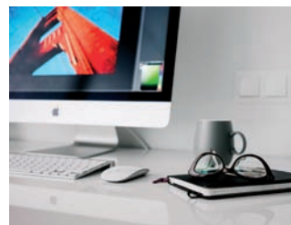
Hilfe im Büro und am PC

info@buergergenossenschaft-weingarten.de