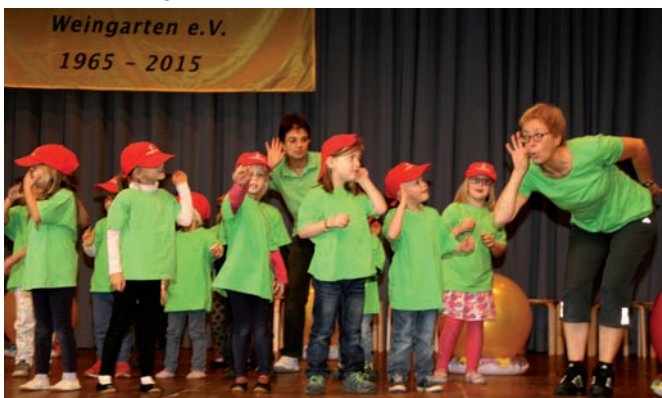
Die Kinder des Kindergartens Waldbrücke

ner, Siegfried Eschbach, 100 Jahre alt. 2014 zählte das Standesamt 98 Geburten und 113 Sterbefälle, 596 Bürger seien weggezogen und 572 zugezogen. In Weingarten seien derzeit sehr viele Projekte am Laufen, berichtete er weiter, aber alles trete in den Hintergrund vor der gewaltigen Aufgabe, die kommenden Flüchtlinge aufzunehmen. Bis Ende nächsten Jahres solle sich Weingarten auf rund 500 Asylbewerber einstellen. Das bedeute für die Gemeinde, dass sie für 7,5 Millionen € Gebäude kaufen oder bauen müsse. Er sei sehr glücklich über die Unterstützung durch den Freundeskreis Asyl. Die Menschen werden eine andere Kultur mitbringen und sie werden zum größten Teil bleiben, also müssten sie integriert werden. Jeder Weingartner, der