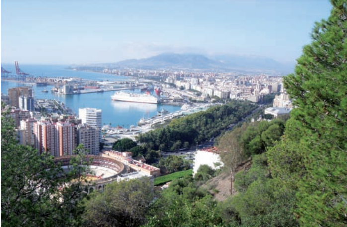
Blick auf Malaga

Am Samstag war die Stadtbesichtigung Sevillas angesagt: prachtvolle Avenidas, vorbei an den Häusern der Expo 1929 und 1992, zur Plaza de Espania und zum Alcazar, der ehemaligen Burg der Maurischen Herrscher.