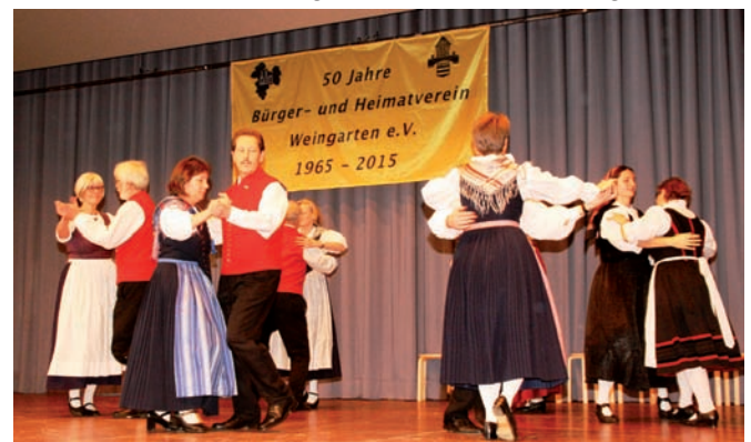
Die Volkstanzgruppe des Bürger- und Heimatvereins und der Volkstanzkreis Karlsruhe gemeinsam