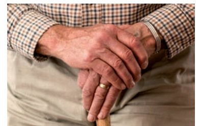
Helfer für den Alltag