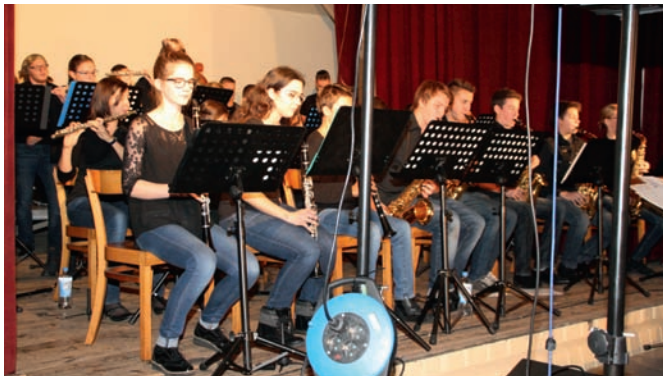
Die Bigband des Thomas-Mann-Gymnasiums

Gelungenes Kooperationskonzert von TMG und Jugend-Musikschule Unterer Kraichgau