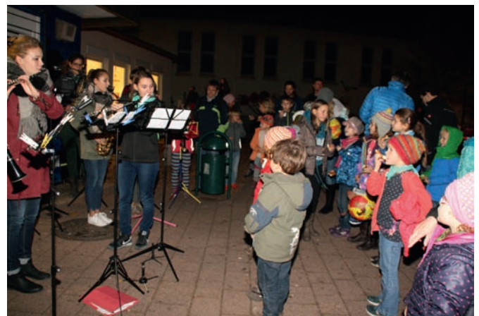
Das Spiel des Musikvereins, Laternen und eine süße Brezel sind vom Martinsfest auf dem Schulhof nicht wegzudenken

Der Heilige Martin hat der Legende nach Jesus Christus in Gestalt des frierenden Bettlers seinen halben Mantel gegeben, wovon auch viele Martinslieder handeln. Daher steht der Aspekt des Teilens und der Spende im Vordergrund. Die Martinsgabe war in diesem Jahr für die Projekthilfe Uganda e.V. Bruchsal bestimmt. Dafür standen an den Verkaufsstellen Spendenbüchsen bereit.