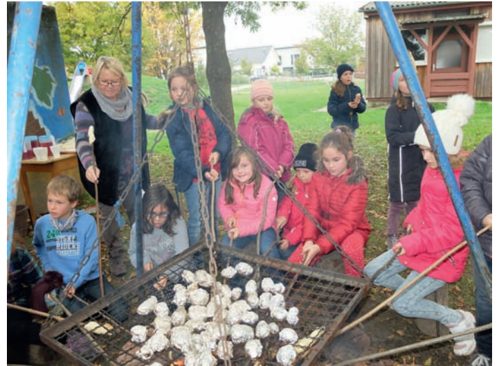
Schüler der Klasse 4c am Kartoffelfeuer