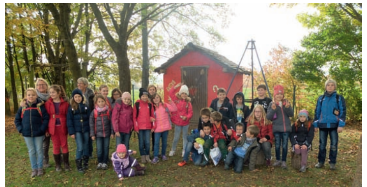
Klasse 4c bei der AWO