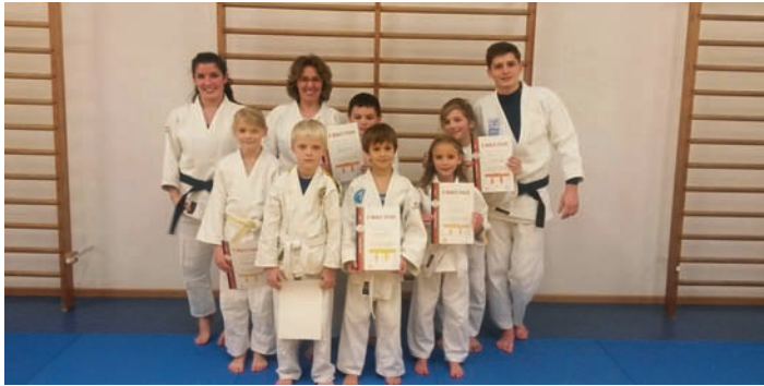
Die Prüflinge der zweiten Stunde.

Nicht vergessen: Zu unserem Jahresabschluss am 18. Dezember laden wir Euch herzlich zu unserem Kinoabend ein.