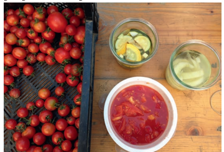
Aus der Fülle des Sommers wurden Köstliche Konserven produziert

Unser nächstes und in diesem Jahr auch letztes Treffen ist am Donnerstag, den 10. Dezember um 20 Uhr im Nebenraum des Goldenen Löwen (Marktplatz 15). Interessierte sind herzlich willkommen, um vorherige Anmeldung unter info@gutesgemuese.de wird gebeten.