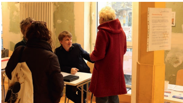
Einblicke ins Repair-Café

info@buergergenossenschaft-weingarten.de