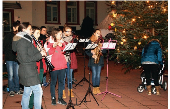
Alljährlich erfreuen Bläser des Musikvereins mit weihnachtlichen Weisen die Besucher auf dem Rathausplatz, die es sich bei Bratwurst und Glühwein der Feuerwehrjugend gut gehen lassen.

schallen über den Platz. Die Menschen lauschen, schauen und genießen das Beisammensein. „Lasst uns froh und munter sein“ erklingt, „Macht hoch die Tür, die Tor macht weit“, „Oh Tannenbaum“, „Jinglebells“ – alles was die Zuhörer kennen und lieben und eine friedliche Atmosphäre breitet sich aus.