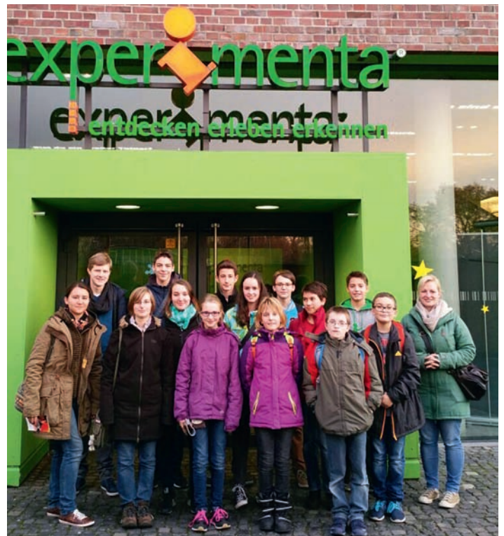
Ausflug des Jugendorchesters zur Experimenta

Traditionell spielen wir für Sie am 24.12. um 17:30 Uhr auf dem Friedhof Weihnachtslieder, um den Heiligabend stimmungsvoll zu beginnen. Wir laden Sie herzlich ein, mit uns die Atmosphäre auf