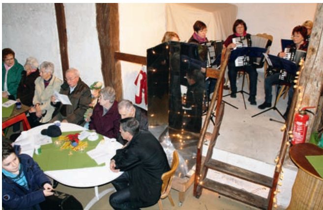
In der gemütlichen Scheune des Fränkischen Hofes lud der Akkordeon-Spielring zum Weihnachtsliedersingen ein.

Es müssen nicht immer die großen Weihnachtskonzerte sein, die die Menschen in der Vorweihnachtszeit erfreuen. Vielmehr sind es gerade die kleinen Veranstaltungen, die zusammenrücken lassen und die Herzen erwärmen. So war es am Sonntagnach-