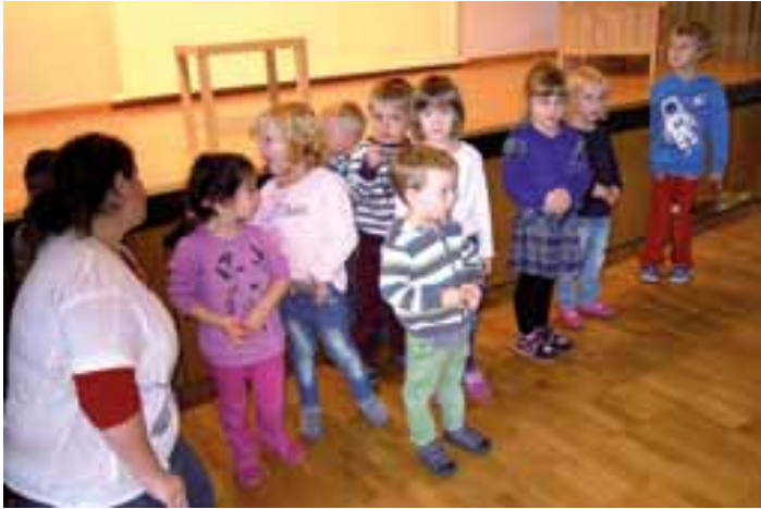
Die Kinder von St. Elisabeth gestalteten die besinnliche Adventsfeier beim Altenwerk mit einem vorweihnachtlichen Spiel