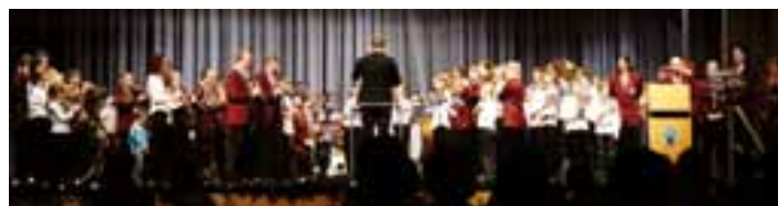
Beim großen Schlusschor sind alle Musiker auf der Bühne.