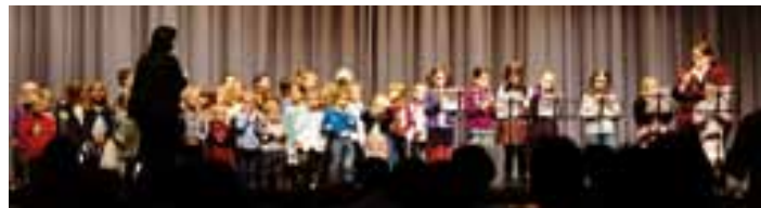
unsere Jüngsten singen voll Inbrunst „Rudolf, das Rentier“

beginnen. Wir laden Sie herzlich ein, mit uns die Atmosphäre auf dem Friedhof zu genießen oder auch zu Hause einmal nach draußen zu lauschen - in vielen Straßen sind die bekannten und beliebten Melodien vom Friedhof her zu hören. Wir wünschen Ihnen allen fröhliche Weihnachten, schöne Feiertage und einen guten Rutsch. Wir hoffen, dass wir uns im neuen Jahr gesund undmunter wiedersehen.