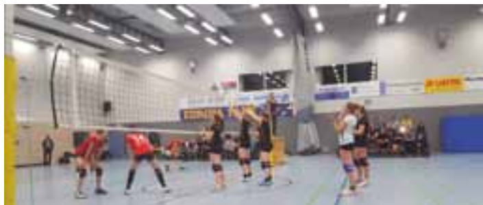
Mit guter Laune zum Sieg im Spitzenspiel

Den Damen des SSC Karlsruhe gratulieren wir selbstverständlich zur Herbstmeisterschaft. Mit einem Punktegleichstand (22 Punkte) rangieren die TSV-Damen nach einer erfolgreichen Hinrunde auf Tabellenplatz zwei und werden nach dem nächsten Heimspiel, das sogleich das erste Rückrundenspiel ist, in die wohlverdiente Winterpause gehen. Daher heißt es am 20.12.2015 zum letzten Mal in diesem Jahr die TSV-Damen in der Mineralix-Arena zu unterstützen, wenn um 15 Uhr gegen die Damen des TB Bad Dürheim angepfeiffen wird. Wir freuen uns auf euch!