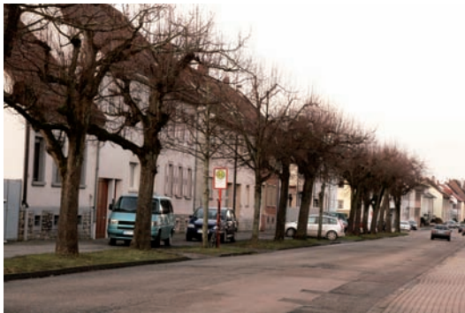
Die mächtigen Linden sind fast alle abgängig und sollen komplett durch neue Bäume mit schmalen Kronen ersetzt werden

Trotzdem bleibe der Straßenraum auf 6,50 Meter erhalten. Allerdings befinde sich ein Teil der Vorgärten auf der Nordseite auf öffentlicher Fläche. Darum sei es erforderlich, von diesen einen Teil „abzuzwacken“, um an dieser Stelle Längsparkplätze zu schaffen. Doch soll die gesamte Parksituation noch einmal anhand einer genauen Stellplatzbilanz kontrolliert und eventuell überarbeitet werden. Der Abwasserkanal werde entsprechend der Regenwasserkonzeption in ein Trennsystem umgewandelt. Im Hinblick auf die Planungen, das Regenwasser mittelfristig über reaktivierte Gräben abzuführen (wir berichteten), müssen die Anwohner der Burgstraße ihre straßenseitigen Dachflächen über Fallrohre direkt an einen eigens dafür angelegten Regenwasserkanal anschließen. Diese Kosten bis zur Grundstücksgrenze müssten die Bürger selbst übernehmen, sagte Bürgermeister Bänziger. Alle anderen Kosten trage die Gemeinde und die jeweiligen Eigenbetriebe. Die teilweise über 80 Jahre alte Frischwasserleitung, die, auch mitbedingt durch den mangelhaften Untergrund, schon häufiger gebrochen war, soll komplett erneuert werden. Der Bauzeitenplan sieht nach Aussage von Ortsbaumeister Oliver Leucht einen Baubeginn noch in 2015 mit dem ersten Bauabschnitt vor, in 2016 werde mit dem dritten Abschnitt fortgefahren, der mittlere Abschnitt komme zuletzt.