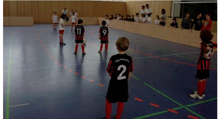
Beim Spielen mit der Rundumbande

Stelle möchten wir uns bei allen ehrenamtlichen Helfern für Euren tollen Einsatz bedanken, das war Klasse. Zusätzlich den vielen helfenden Händen bei der Turnierorganisation wie auf- und Abbau und der Turnierleitung für den reibungslosen Ablauf. Auch der Gemeinde Weingarten für die Bereitstellung der Walzbachhalle und den vielen Sponsoren ohne die eine solche Veranstaltung nicht zu finanzieren wäre. Schön war es auch zu sehen wie zahlreiche Mitglieder Ihren „Frühschoppen“ bei uns verbracht hatten. Alles in Allem eine runde Sache, herzlichen Dank !!