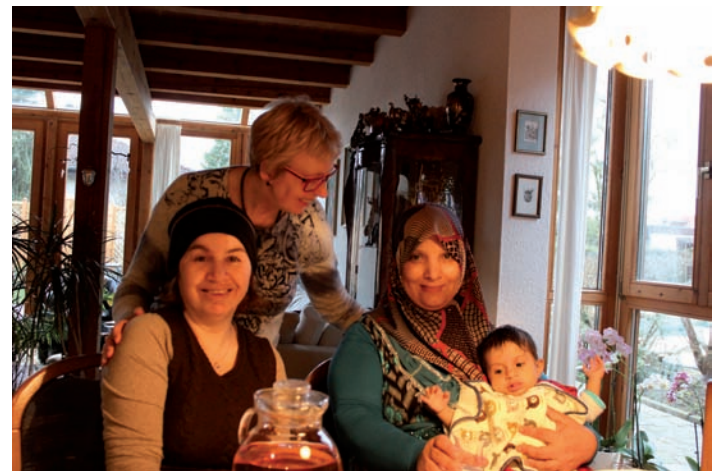
herzkrankes 9 Mon. altes Mädchen und Mutter werden herzlich empfangen