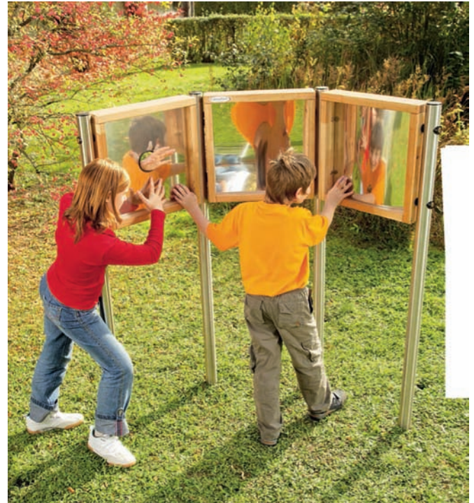
Interaktives Spiel mit Spiegelfolie ist ein Beispiel für ein Element des Sinnespfades

Die Finanzierung erfolgt teilweise aus dem Projektfördertopf. Um den finanziellen Spielraum noch zu erweitern, wurde jetzt ein Crowdfunding-Projekt ins Leben gerufen. Bis zum 22.8. können über die Volksbank Bretten-Bruchsal noch Spenden auf das Projekt eingezahlt werden. Für jeden Spender wird als Dankeschön ein bemalter Stein mit Namen angefertigt. Die Steine werden in Form einer „Schlange“ in den Sinnespfad integriert. Bei der Anfertigung der verschiedenen Elemente ist das Netzwerk noch auf Unterstützung angewiesen. Dankenswerterweise haben sich schon die AG-NUS e.V., das Jugendzentrum Weingarten und die Werkrealschule zur Kooperation bereit erklärt. Ein ortsansässiger Holzbearbeitungsbetrieb spendet bereits Material. Der Sinnespfad mit den ersten Sinnelementen wird am 6. August beim Sommerfest des Netzwerks eröffnet werden. Wer das Netzwerk über das Crowdfunding-Projekt noch finanziell unterstützen möchte, kann dies gerne tun unter: https://vb-bruchsal-bretten.viele-schaffen-mehr.de/sinnespfad Auch