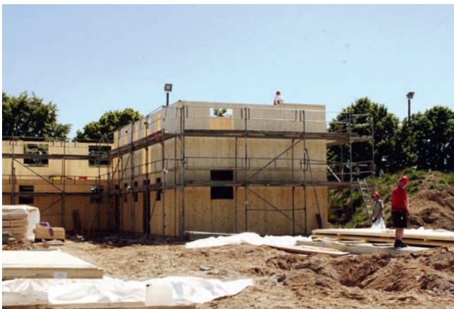
Die massive Holzbauweise ermöglicht zügiges Bauen

Die Unterkünfte für Asylbewerber auf dem alten TSV-Gelände machen rasante Baufortschritte. Der Weingartner Unternehmer Holzbau Schulz erstellt dort als Generalübernehmer in Massivholzfertigbauweise zwei zweigeschossige Gebäude mit Wohnungen für jeweils 60 Personen. Die beiden spiegelverkehrten Grundrisse ergeben jeweils eine „Wagenburg“ mit einer großen Öffnung zu einem Innenhof. Das obere Stockwerk wird durch einen umlaufenden Stahlbalkon erschlossen.