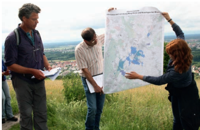
Karte des Gesamtgebiets „FFH Kinzig-Murg-Rinne und Kraichgau bei Bruchsal“