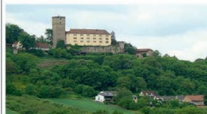
Gutenberg in Haßmersheim