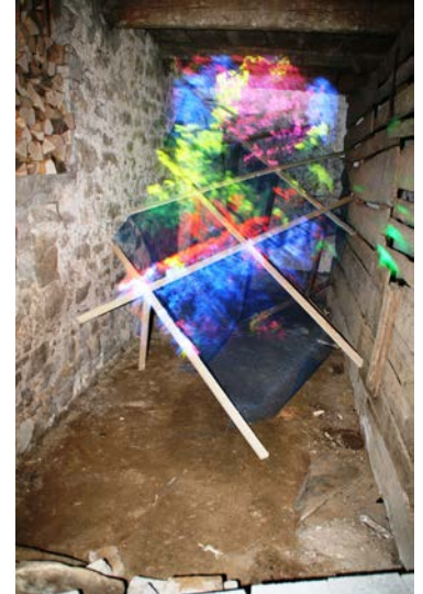
Das Computerprogramm „Ant“ (Ameise) bewirkt die unaufhörliche Entstehung von neuen Farbmustern auf einer Konstruktion aus Holz und Draht.