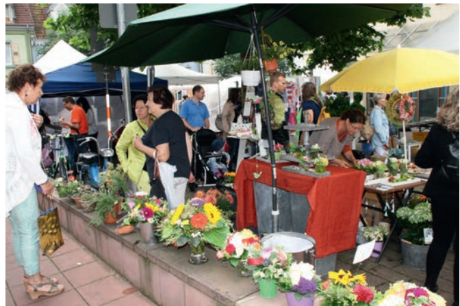
Auch Floristik ist ein künstlerisches Handwerk und darum auf dem Frauenkreativmarkt willkommen