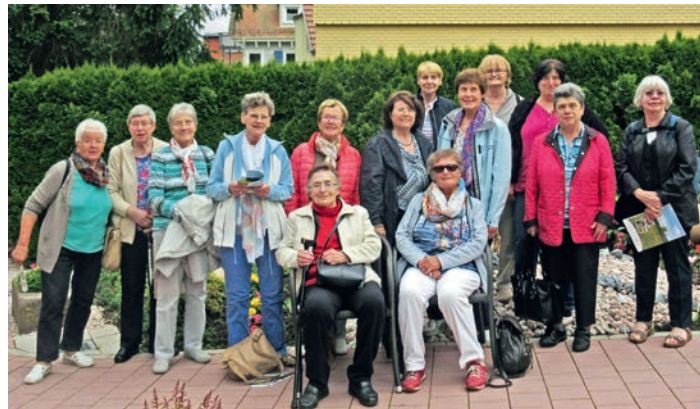
Ein Teil der Reisegruppe in Schömberg

Bürger- und Heimatverein Weingarten e. V.