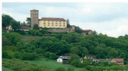
Gutenberg in Haßmersheim