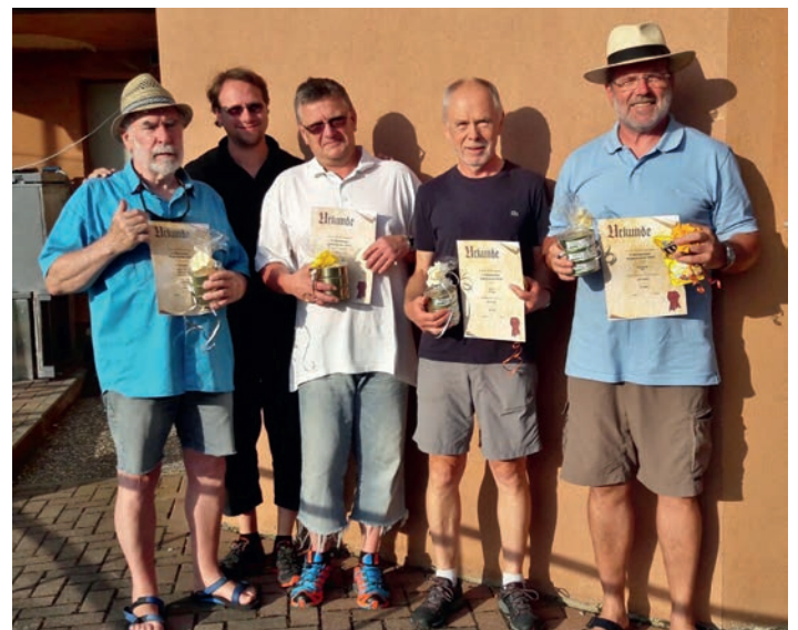
Die erfolgreichen Bogenschützen vom Wiesentaler Bogenturnier.

Wir gratulieren recht herzlich zu diesen tollen Ergebnissen und wünschen unseren Bogenschützen weiterhin „alle ins Gold“.