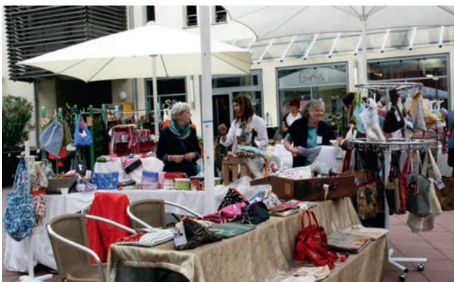
Cooler Taschen aus verschiedenen Materialien, originell und ausgefallen, aber solide gearbeitet, waren an mehreren Ständen zu finden.

Seit 12 Jahren laden das Frauenfrühstücksteam „Vitamin F“ zum Frauen kreativmarkt auf den Rathausplatz ein. Jedes Jahr ist dieser Markt mehr als eine Verkaufsgelegenheit. Er ist eine Plattform für