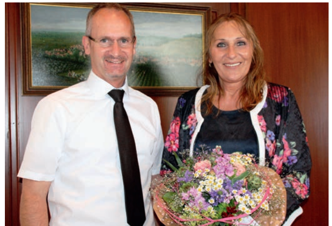
Die Grüne Landtagsabgeordnete Andrea Schwarz beim Antrittsbesuch im Weingartner Rathaus

Zum Thema Öffentlicher Personennahverkehr sprach der Bürgermeister eine bereits vorliegende Zusage auf Bezuschussung