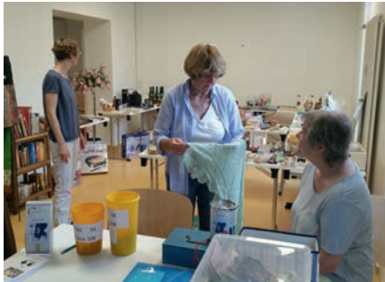
Preisausgabe im Begegnungszentrum Bahnhofstr. 3

vielen guten Gespräche und Begegnungen sind uns auch jedes Mal ein Ansporn, trotz des großen Aufwandes, eine Tombola zu organisieren. Daher wollen wir uns bei allen Teilnehmern der diesjährigen Tombola ganz herzlich bedanken. Ebenso danken wir dem Familienzentrum Allerdings und der Bürgergenossenschaft Weingarten für die Überlassung der Räumlichkeiten sowie Vitamin F und dem Anglersportverein für die freundliche Unterstützung. Es war ein tolles Miteinander!