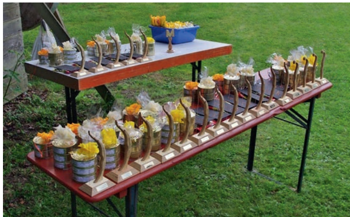
Ein Teil dieser Preise ging an unsere erfolgreichen Bogenschützen