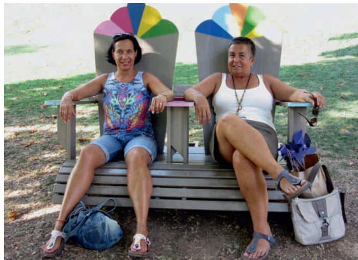
GV Frohsinn: Die Pause ist vorbei - bitte Chorproben trotz Hitze und Sommerwetter nicht verpassen!

Die Pause ist vorbei - bitte Chorproben trotz Hitze und Sommerwetter nicht verpassen!