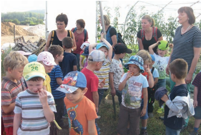
Selbstgeerntete Karotten schmecken einfach spitze

kus“ sowie der Schulkindbetreuung gefolgt. Nach dem Fußmarsch zum Feld und anschließender Stärkung durften wir zum Einstieg insgesamt ca. 60 Kinder und ihre ErzieherInnen durch den kleinen Folientunnel mit den Nachtschattengewächsen begleiten (Tomaten, Auberginen). Die Kinder schlichen wie die Katzen durch die Gemüserreihen, um keine Pflanze zu beschädigen und gleichzeitig alles genau anschauen zu können. Im Tomatentunnel faszinierten sie vor allem unsere Hummeln. Wir guckten in ihre Häuser, um sie genau zu erkunden. Außerdem entdeckten die Kinder noch andere Tiere wie Spinnen, Käfer und Schmetterlingspuppen im Tunnel und am Acker. Um die Vielfalt dieser wichtigen Tiere zu erhalten, legt der Bauer extra Blühstreifen an. Höhepunkt für alle war, als Mike den großen Traktor bestieg und mit seinem Flug eine Karottenreihe freilegte. Alle durften sich nun als Erntehelfer betätigen und als „Lohn“ die köstlichen Karotten probieren.