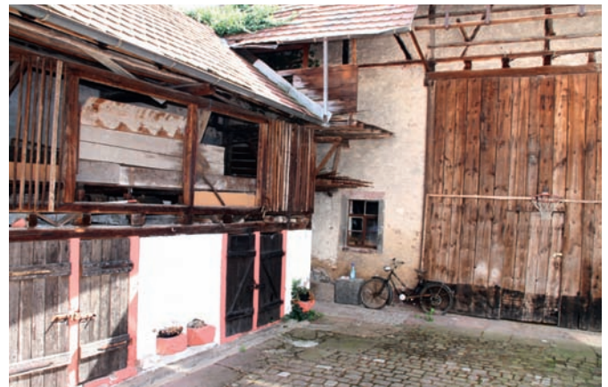
Das stattliche Gebäude in der Kirchstraße 31 wurde später als zweigeteiltes Bauernhaus mit großer Scheune und Ställen genutzt.

Von außen lässt das stattliche Haus auf den ersten Blick seinen historischen Wert gar nicht so deutlich erkennen. Denn die Front des traufständigen Gebäudes ist teilweise mit Kunststoffelementen verkleidet, und nur das barocke Hoftor und der von der Kirchstraße aus zu sehende Fachwerkgiebel weisen auf seine Historie hin. Der Bürger- und Heimatverein unterstützte die Aktion seines Mitglieds und bot dort sein interessantes Literatur-Angebot zum Kauf an.