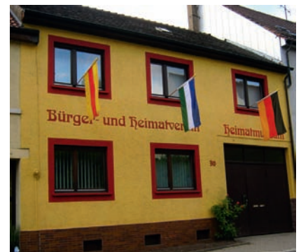
Am Sonntag veranstaltet der Bürger- und Heimatverein das vierte Museumsfest im Heimatmuseum in der Durlacher Straße.

wurde Ende September 2012 eröffnet und stößt seither auf gute Resonanz in der Bevölkerung von Weingarten. Aber auch Gruppen von auswärts melden sich immer wieder zu einer Führung an. Ein Schwerpunkt der Dauerausstellung ist die Ur- und Frühgeschichte mit den Stationen Steinzeit, Kelten, Römer, Alemannen, Merowinger und Mittelalter mit Exponaten, die überwiegend bei Ausgrabun-