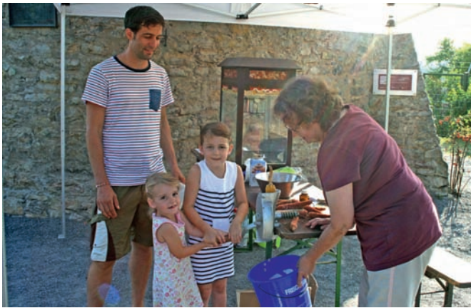
Die Maisentkörnung per Maschine ließen sich viele Erwachsene und Kinder erklären. Im Hintergrund steht die Popcorn-Maschine.

(rof). Mehr als 8 000 historische Baudenkmale, Parks oder archäologische Stätten öffneten am „Tag des offenen Denkmals“ am vergangenen Sonntag deutschlandweit ihre Türen. Entsprechend dem Motto dieses Jahres „Gemeinsam Denkmale erhalten“ konnten die Besucher auch in Weingarten vor Ort erleben, dass nicht nur Bund, Länder und Gemeinden, sondern auch Vereine und engagierte Einzelpersonen bemüht sind, das bauhistorische Erbe vor dem Verfall zu bewahren.