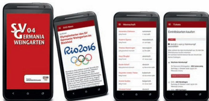
Der SVG auf deinem Smartphone!