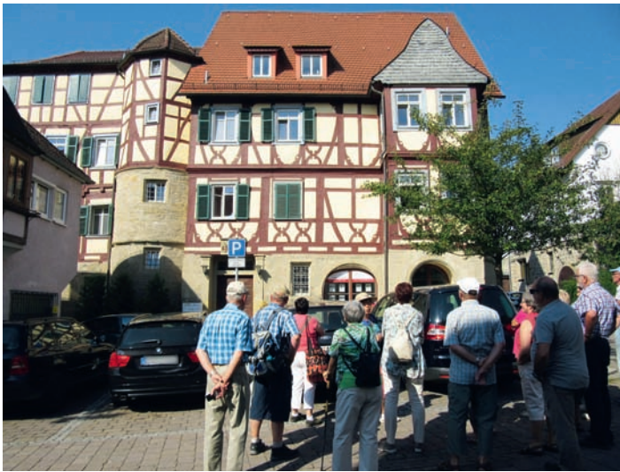
GV Frohsinn: Fachwerk in Öhringen