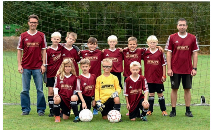
Die E2-Jugend in Eggenstein