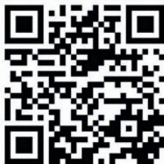
Einscannen und SVG-App installieren

Die Installation ist regulär über den Google Play Store sowie über den App Store von Apple möglich. Am schnellsten geht es über den QR-Code.