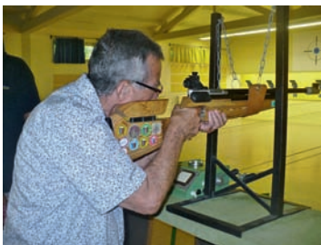
Spanischer Teilnehmer mit Schießhilfe.