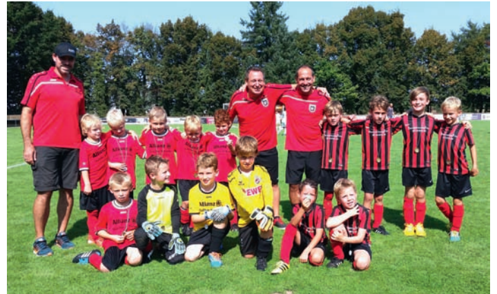
Die beiden siegreichen Mannschaften der F1 und F2

tät schnell abgelegt werden konnte und zahlreiche, sehenswerte Treffer erzielt wurden. Ein ganz herzlicher Dank für den zusätzlichen Motivations Schub durch das super Outfit geht an die SAM-Stuckateure!