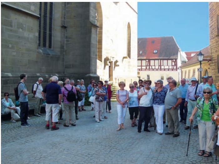
GV Frohsinn: Ausflug zur Landesgartenschau