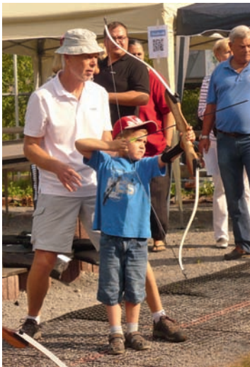
Auch die Kleinen versuchten sich in Bogenschießen