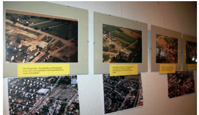
Interessant, spannend und viele Erinnerungen weckend sind die Luftbilder aus den 60er Jahren, die derzeit im Heimatmuseum in der Durlacher Straße 30 ausgestellt sind. Die Beschriftung erklärt, was zu sehen ist und was damals noch nicht gebaut war.