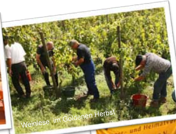
Weinlese im Goldenen Herbst