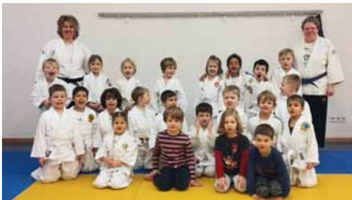
Unsere Judo Waschbärengruppe

Im Laufe des Frühjahrs werden die ersten Waschbären die fleißig Aufkleber in ihrem Judo Kinderpass gesammelt haben den weissen