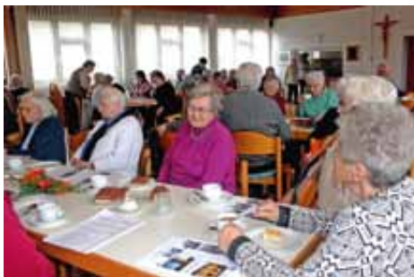
Gut besucht war der erste Seniorennachmittag des Katholischen Altenwerks im neuen Jahr im Saal des Gemeindezentrums.