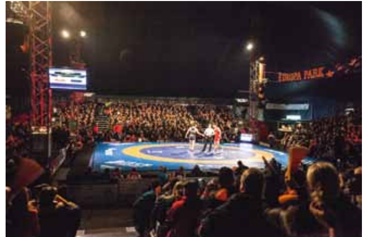
Gute Stimmung im Event-Zelt auf dem Festplatz

75F: Georg Harth - Kiril Terziev 9:5 (2:0)