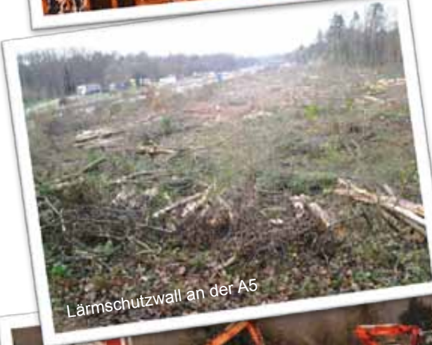
Lärmschutzwall an der A5