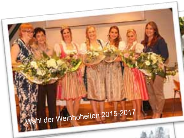
Wahl der Weinhoheiten 2015-2017

Amtliches Mitteilungsblatt der Gemeinde Weingarten