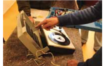
Altes funktioniert wieder

info@buergergenossenschaft-weingarten.de