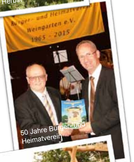
50 Jahre Bürger- und Heimatverein