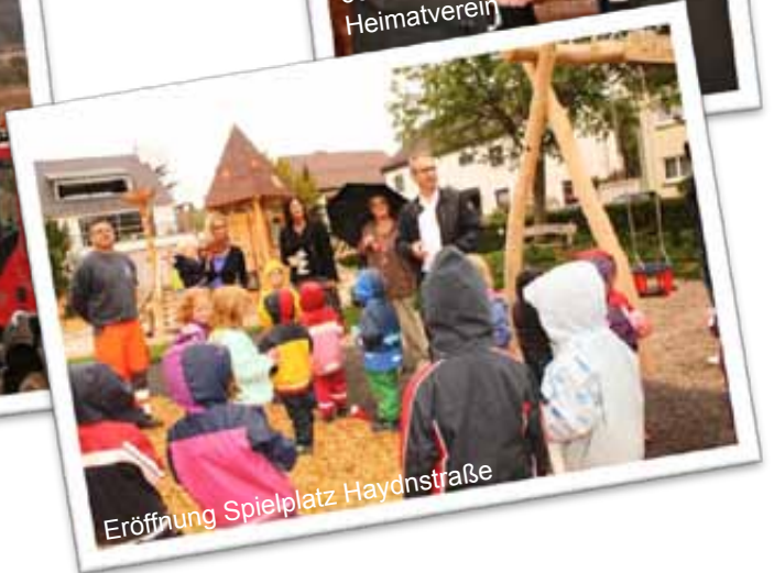
Eröffnung Spielplatz Haydnstraße