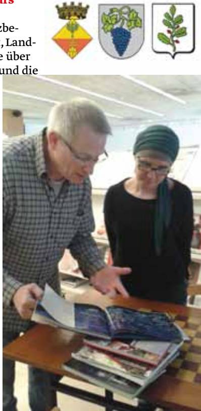
Der Vorsitzende des Partnerschaftskomitees bei der Bücherübergabe