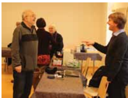
Experten im Dialog

Reger Zuspruch hatte das zweite Repair-Café am 16.2.2016 in der Bahnhofstrasse 3. Familienzentrums Allerdings und Bürger helfen Bürgern ergänzen sich in wunderbarer Weise. Besonders schön ist der Zuspruch auch vorn Ausserhalb.