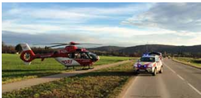
Notfallhilfe am Einsatzort

Möchten Sie mehr über die NOTFALLHILFE erfahren? Besuchen Sie einen Dienstabend der Sanitätsbereitschaft, sprechen uns persönlich an oder schreiben uns eine Mail über info@drk-weingarten.de .