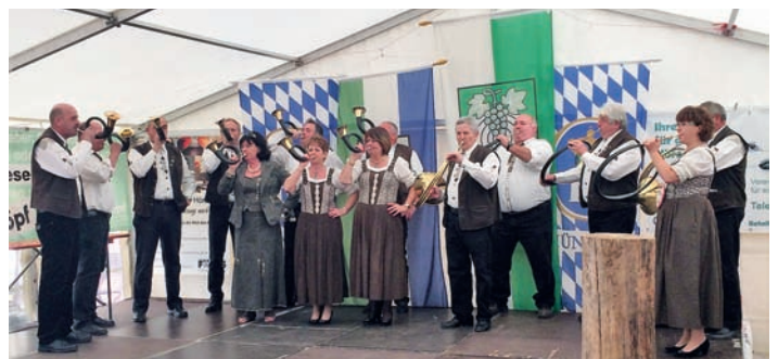
Eröffnung der Siegerehrung