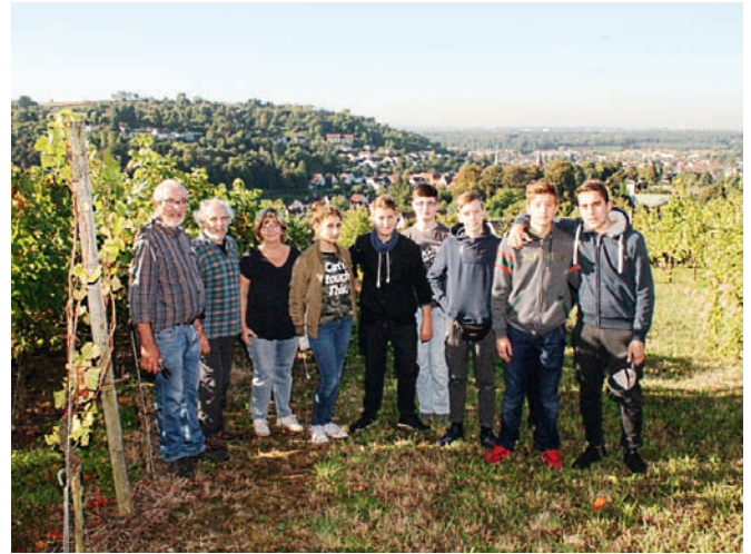
Letzte Lese am alten Standort