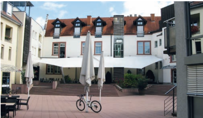
Planansicht des Fahrstuhls