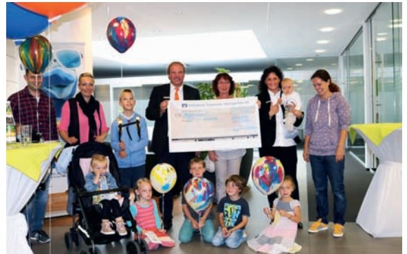
Einen Scheck über 800 Euro überreichte die Volksbank Stutensee-Weingarten an den Verein B.L.u.T. eV. Der Erlös stammt aus den erlaufenen Spendengeldern beim Lebenslauf und aus einem Luftballonwettbewerb.