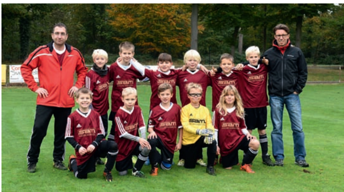
E2-Junioren in Linkenheim

Am letzten Spieltag der E2 Juniorensaison 2016 waren die Jungs des Jahrgangs 2007 zu Gast beim FV Linkenheim. Um es kurz zu machen: es dürfte sich um eines der dramatischsten Spiele der ganzen Staffel gehandelt haben, nach aufopferungsvollem Kampf endete die Partie 6:6.