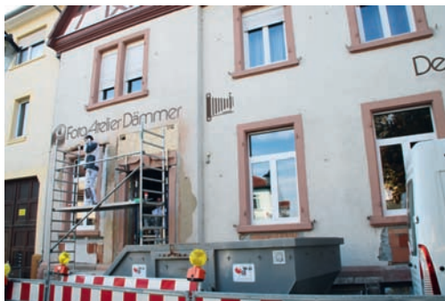
Das ehemalige Fotogeschäft Dämmer wird umgebaut

Im Gastraum soll auch ein Tresen für Speisen zum Mitnehmen eingerichtet werden, ebenso eine Kinderspielecke. Die Sanitäreinrichtungen kommen in einen neu zu erstellenden Anbau. Der Gastraum, fasst rund 40 Sitzplätze, genau so viele sind als Außenbewirtschaftung vorgesehen. Diese soll sich auf der Freifläche zwischen der Fahrbahn und einem Ensemble aus historischem Brunnentrog und Baum an der Straßenecke gruppieren. Der Gehweg verläuft weiterhin am Haus entlang. Die Fertigstellung ist auf Anfang Dezember avisiert.