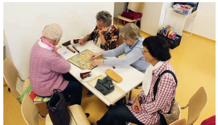
Volle Konzentration beim Scrabble

Bürgergenossenschaft und Ortsseniorenrat laden ein: Nachdem der erste Spielenachmittag ein voller Erfolg war, folgt nun die zweite Runde! Die Bürgergenossenschaft schließt sich der Einladung des Ortsseniorenrats (siehe dortiger Bericht) an und möchte hiermit ebenfalls zum 2. Spielenachmittag am Donnerstag, dem 10. November von 15 bis 18 Uhr in der Bahnhofstraße 3 einladen. Wir freuen uns auf Sie!