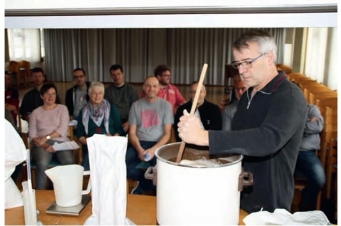
„Hopfen und Malz - Gott erhalt's“: Bier brauen nach klassischer Methode

„Einmaischen“ hieß dieser Vorgang und jeder schaute erwartungsvoll zu. Nun wurde die Temperatur langsam auf 52 Grad erhöht. Vorsicht, dass es nicht schäumt und überläuft oder sich am Boden festsetzt. Also immer wieder rühren. In der Zwischenzeit berichtete Wagner allerlei Interessantes: Dass ein Haus- und Hobbybrauer im Haushalt bis zu zwei Hektolitern Bier im Jahr für den eigenen Verbrauch herstellen darf, ohne Biersteuer bezahlen zu müssen. Oder dass beim Abfüllen die Flaschen gut gefüllt sein sollten, damit kein Sauerstoff die Qualität beeinträchtigt. Er empfehle Bügelflaschen. Beim Säubern sei äußerste Sorgfalt anzuwenden, denn wenn sich einmal ein Schimmel festgesetzt habe, sei der kaum noch rauszubekommen. Die erforderlichen 52 Grad waren erreicht. Nun hieß es, die 25 Minuten dauernde „Eiweißrast“ abzuwarten. Kein Problem,