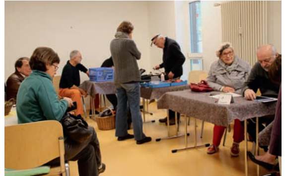
Seit rund einem Jahr gibt es das Repair Café in der Bahnhofstraße 3 und das Angebot wird durchgängig gut angenommen