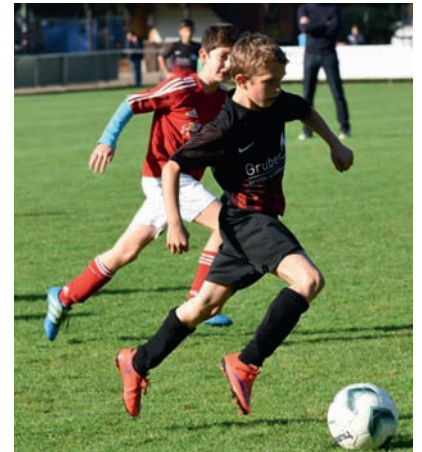
E1-Junioren in Linkenheim

Auch wenn die erste Hälfte noch ausgeglichen war, gingen die Weingartener mit einem 1:0 in die Pause. Zu Beginn der zweiten Spielzeit erhöhten Sie dann nochmals den Druck und überzeugten durch spielerische Überlegenheit und großer Spielfreude. Die übrigen Tore fielen dann zwangsläufig, womit sich die Mannschaft für eine tolle Leistung mit einem Sieg belohnte. Diese Klasse Leistung bestätigte Ihre tolle Entwicklung in den vergangenen Monaten und lässt auch für die anstehende Hallenrunde vieles erwarten.