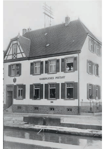
So hat das historische Gebäude aus dem Jahr 1911 einmal ausgesehen.