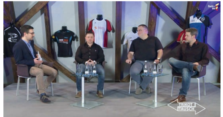
Aufzeichnung der Sendung „Trikottausch“

Die Sendung wurde bereits auf Baden TV ausgestrahlt, kann aber jederzeit über die Mediathek unter www.baden-tv.com abgerufen werden.