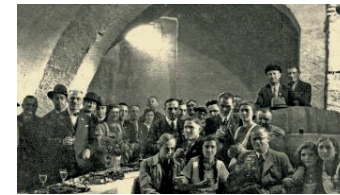
Weinprobe im Grundschulkeller 1937.