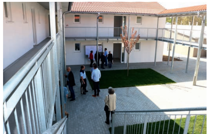
Diese Wohnungen mietet der Landkreis als GU

„Im Erdgeschoss sind alle barrierefrei, so dass sie sich auch für ältere Menschen eignen.“ Zu sehen war das kleinere Modell, eine Zwei-Zimmer-Wohnung mit Küchenzeile und Bad.