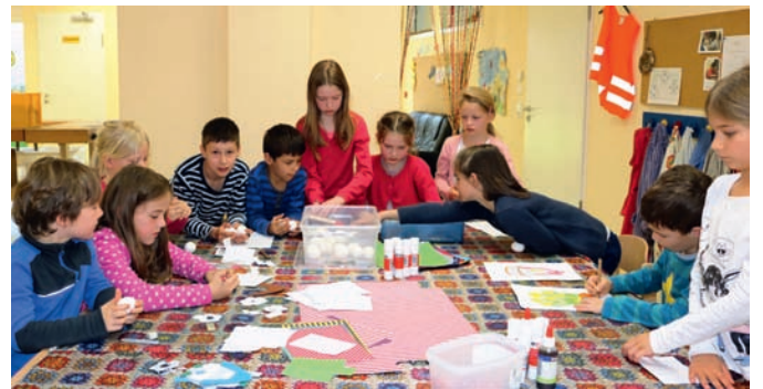
Im Schülerhort ist immer etwas los. In den Osterferien sind natürlich Osterbasteleien angesagt.

Die zweite Ferienwoche beginnt am Dienstag nach Ostern mit kreativem Werken. Jedes Kind kann einen Kreisel bauen und an einem Kreiseltturnier mitmachen. A Mittwoch ist Spielen und Picknick auf dem Eisbergspielplatz angesagt (bei schlechtem Wetter in der Turnhalle. Am Donnerstag gibt es einen Ausflug mit der Straßenbahn in die Kunsthalle nach Karlsruhe zur Ausstellung „Zauberwelten“ von Cornelia Funke und am Freitag gibt's zum guten Schluss noch „Spiel und Spaß“ auf dem tollen Spielgelände in der AWO in Weingarten.