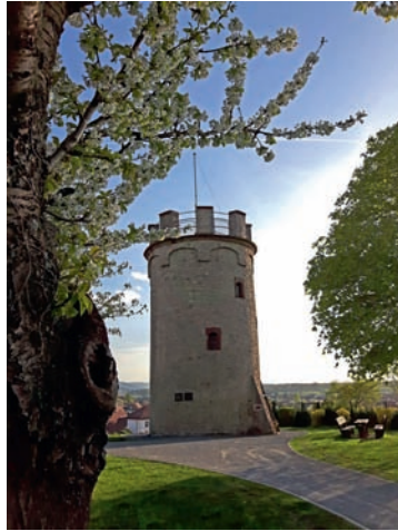
Frühling am Warturm: Er ist das markante Weingartener Wahrzeichen. Am Ostersonntag öffnet das „Museum im Turm“ wieder seine Pforten.

wirtschaft und dem Weinbau. In beiden Museen sind auch Sonderführungen für Gruppen nach Voranmeldung möglich. Zu den gleichen Öffnungszeiten kann man ab Ostern auch das neue Heimatmuseum in der Durlacher Straße ebenfalls an Sonn- und Feiertagen bei freiem Eintritt besichtigen. Außer der Ur- und Frühgeschichte sowie der Naturkunde und dem Künstlerzimmer gibt es dort auch Aktivitäten für Kinder. So können diese eine alte Nähmaschine und historische Schreibmaschine ausprobieren oder sich an einer Schulbank im Schreiben mit Gänsefedern versuchen. Außerdem ist dort noch die interessante Sonderausstellung „Weingarten in Luftbildern aus den 1960er Jahren“ zu sehen. Schließlich kann am dort auch die vom Verein herausgegebene heimatkundliche Literatur kaufen.