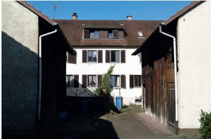
Marode Bausubstanz und kleinteilige Bebauung machen Überplanung notwendig

chen geschützt bleiben. Ging es in den letzten Jahrzehnten um immense Neuausweisungen, so ist in der Politik mittlerweile die allgemeine Erkenntnis angekommen, mit Flächen sparsam und ressourcenschonend umzugehen. Die WBB kämpfte bekanntermaßen lange und intensiv um den Erhalt der Breitwiesen. Nun wird es amtlich, dass zumindest ein Teil Bauerwartungsland aus dem FNP gestrichen wurde. Erweiterungen der verlängerten Höhefeldstraße sind nur noch max. 50 Meter möglich. T. Martin