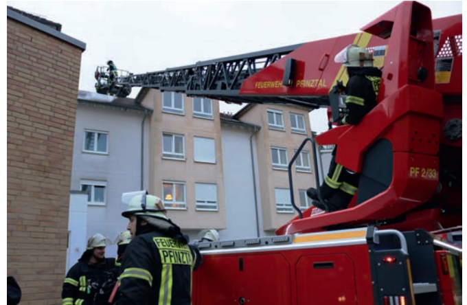
Die Weingartner Wehr arbeitet bei besonderen Einsätzen mit der Hilfe von externen Wehren zusammen. In diesem Fall war die Drehleiter der Feuerwehr Pfnzthal vor Ort, um Bewohner des Pflegeheims über Fenster und Balkone zu „retten“.