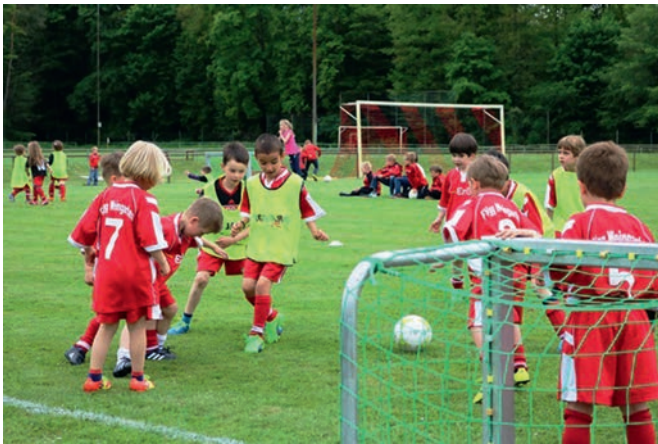
Auch die „Bambinis“ waren mit Feuer und Flamme dabei. Sie sind die jüngste Altersklasse der Fußballjugend.

Gut besuchte „Familientage“ im Waldstadion