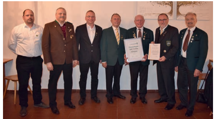
Schützenverein Weingarten überreicht Gastgeschenk an die Zellbachtaler Schützen.