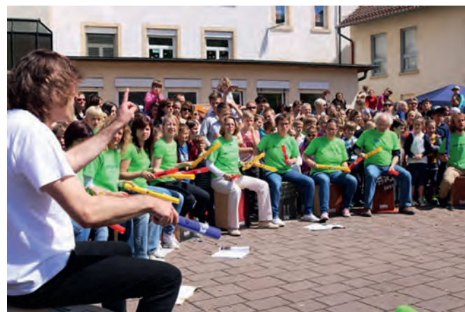
Ein Großteil des Kollegiums beteiligte sich an einer tollen Trommel-Vorführung