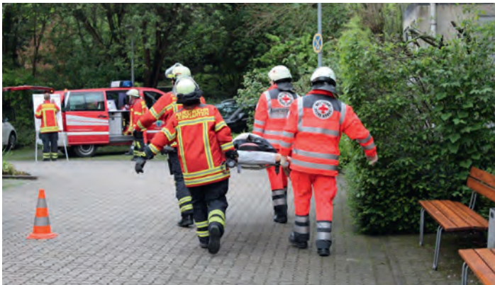
DRK und Feuerwehr - Hand in Hand

Wir bedanken uns bei der Freiwilligen Feuerwehr für die Planung und Teilnahme an der Übung, dem Haus Edelberg und seinen Bewohnern für die Möglichkeit der Durchführung.