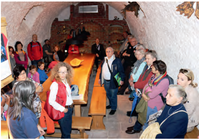
Der Gewölbekeller unter dem Gasthaus „Krone“ ist zu einem privaten Feierraum ausgestaltet. Das Kalksteinmauerwerk wurde hier verputzt.

Die heutige Bundesstraße 3 war seit jeher ein wichtiger Handelsweg von Frankfurt nach Basel und von Staffort nach Bretten kreuzte ein weiterer Verbindungsweg die Ortsmitte. Weingarten war ein Marktflecken.