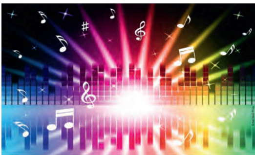
© Liederkrantz 1862 Weingarten e. V.

Ja, denn auch das haben wir bei unserem Besuch in Katalonien gesehen - viele kleine bunte Stückchen können ein wunderbares Kunstwerk ergeben. Der große katalanische Künstler Gaudi hat uns ebenso zu diesem Konzert inspiriert.