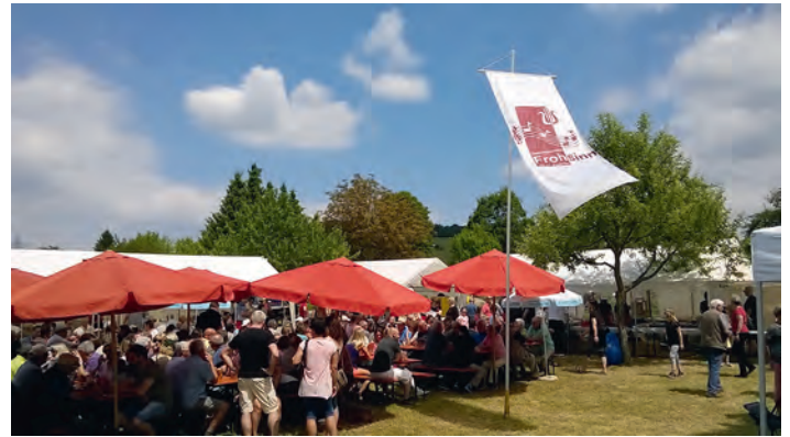
Turmfest 2017 des GV Frohsinn