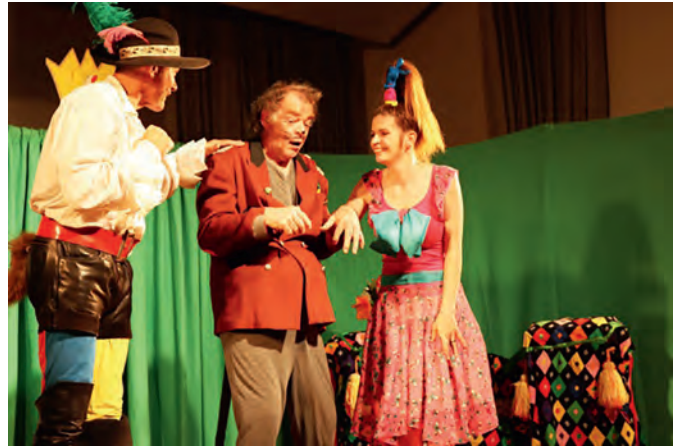
Mit Spielwitz und Leidenschaft begeisterte das „Rotznasentheater“ auf Einladung der AGNUS-Jugend am Sonntag die Kinder im evangelischen Gemeindehaus.