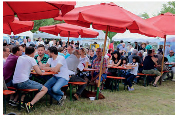
Das zehnte Turmfest des Gesangsvereins „Frohsinn“ war dank des Superwetters erneut ein voller Erfolg

Um die Mittagszeit bildeten sich lange Schlangen an den Verpflegungsständen und die Besucher genossen den ruhigen Feiertag. Eine Jazzcombo, die „3erlei“ aus Bruchsal, erfreute mit angenehmer Musik von Saxofon, Bass und Piano. Zahllose Einheimische, die die Kulisse von bekannten und vertrauten Gesichtern schätzten, waren ebenso zugegen wie die vielen Ausflügler, die auf einer „Watertagswanderung“ vorbeigekommen waren. Auch das Heimatmuseum im Turm, erwies sich als Publikumsmagnet. Der Bürger- und Heimatverein hatte das Museum mit historischen Exponaten aus Haus, Hof und Landwirtschaft bereits seit elf Uhr geöffnet und die „Synergieeffekte“ waren an diesem Tag sprichwörtlich.