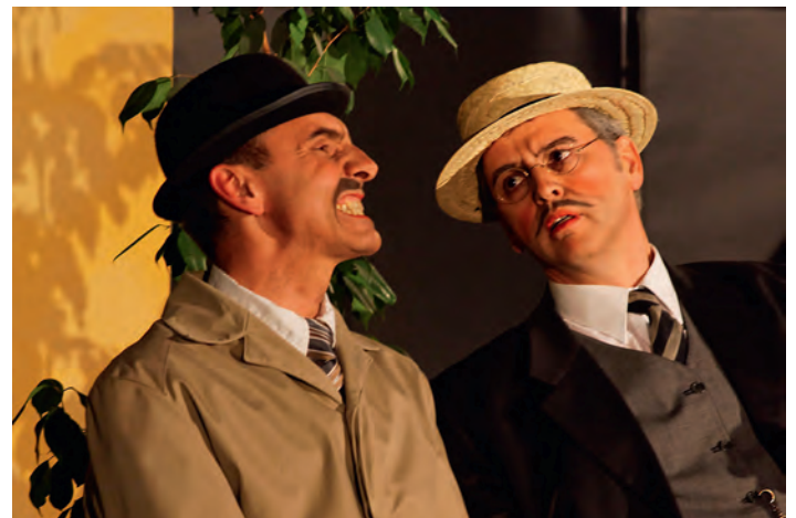
„Häberle und Pfeilerer“ sind auch 2017 mit dabei.

Moderator Markus Kleefeld wird Ihnen das Programm näherbringen und unser musikalischer Partner ist in diesem Jahr der Musikverein Weingarten. Beginn ist um 19.30 Uhr, Einlass ab 18.45 Uhr. Vor Beginn und in der Pause bewirten wir Sie mit Häppchen und kühlen Getränken. Karten bekommen Sie an der Abendkasse oder ab 1. Juni im Vorverkauf bei der Buchhandlung „Bücherwurm“. Der Eintritt kostet 10 Euro, ein Glas Sekt ist im Preis enthalten.