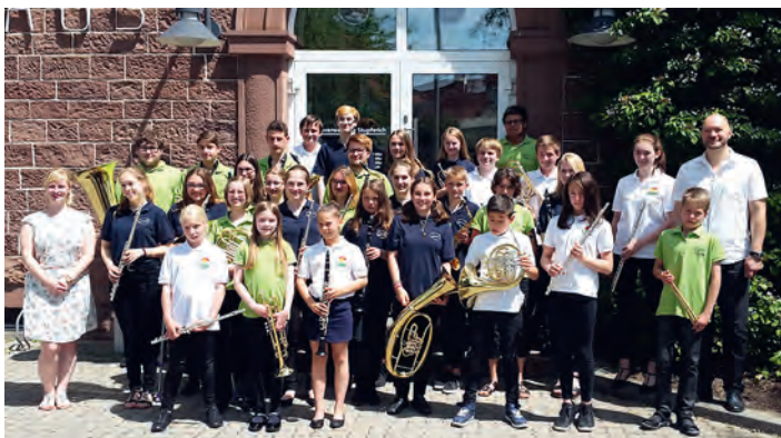
Viel Spaß zusammen: die Jugendorchester Weingarten, Stupferich und Spessart.

Besuche uns auch im Internet unter www.musikverein-weingarten.de und auf Facebook.