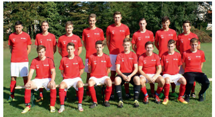
In der nächsten Spielzeit wartet die Landesliga auf unsere A-Junioren