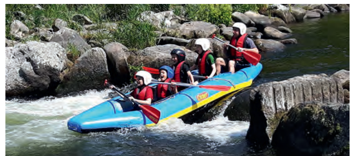
E2: Rafting auf dem reißenden Fluss...