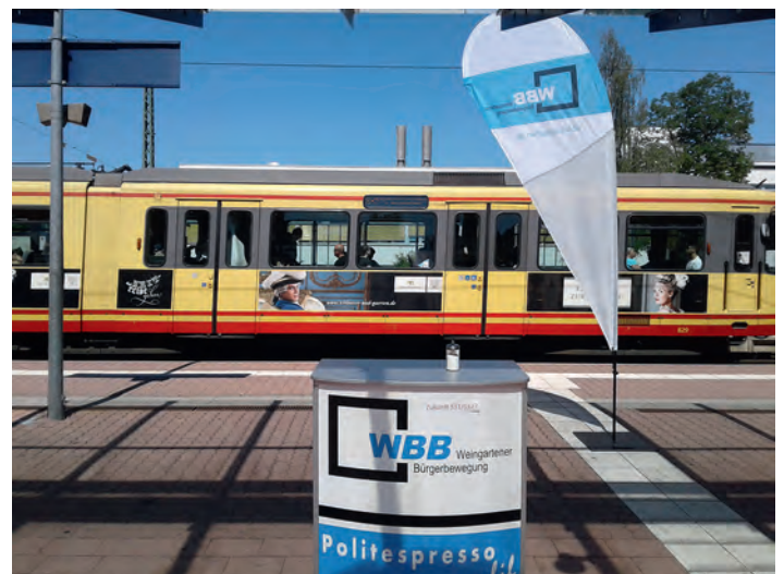
Insgesamt 10 Stunden wurden Bahnfahrer zu unterschiedlichen Zeiten durch Vertreter der WBB befragt, 211 Bahnfahrer