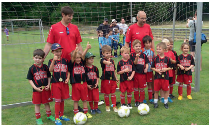
Bambinis: Unser erfolgreiches Team

haben sich die Kinder (und die mitgereisten Eltern) sehr über den Turniererfolg gefreut.