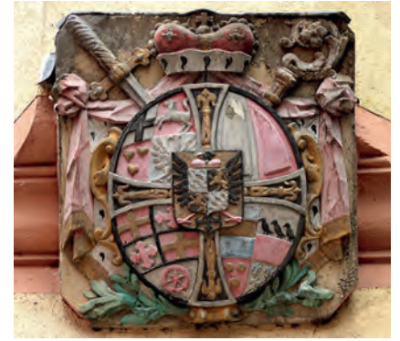
Das interessante Wappen am Eck des evangelischen Pfarrhauses ist ein Blickfang im historischen Ortskern Weingartens.

Anno 1809 hob Napoleon den Deutschorden in den Staaten des Rheinbunds auf. Seine Liegenschaften in Weingarten von zirka 25 Hektar, die an den badischen Großherzog fielen, hatten acht Weingartener Bürger 1813 als Erblehen erworben. Bis 1809 war Bad Mergentheim Zentrale des Deutschordens, wo heute noch das Schloss und die Barockkirche von Balthasar Neuman berechtigt Zeugnis von dessen Macht und Pracht ablegen.