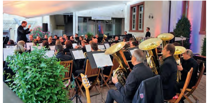
Stimmungsvolles Sommernachtskonzert

Anmeldung? Bei Doris Hörter (07244-742001, musikgarten@musikverein-weingarten.de )