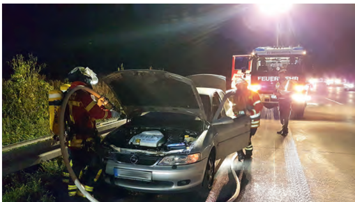
Bericht: Thomas Heinold Pressesprecher der Feuerwehr Weingarten