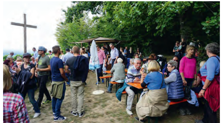
Verdiente Rast am Gipfelkreuz