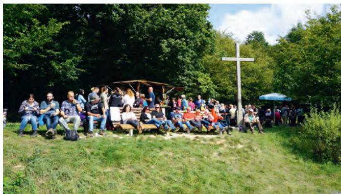
Genusspause mit großartiger Aussicht auf Weingarten

Beim 29. Weingartner Wein-Wandertag werden die Besucher wieder direkt an die Rebe gebracht