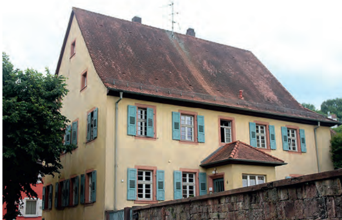
Der heutige evangelische Pfarrhof mit Wohnhaus, Scheune und Gewölbekeller war der Pflegehof des Deutschordens in Weingarten.

In Weingarten nimmt sich der Bürger- und Heimatverein seit Jahren der Anliegen der Stiftung an und hat dies an mehreren Objekten wie dem historischen Wartturm oder dem Haus Krumes in der Kirchstraße 29, in dem die erste Apotheke in Weingarten untergebracht war, deutlich gemacht. In diesem Jahr wird das Thema „Macht und Pracht“ am evangelischen Pfarrhof an der Ecke Kirchstraße/Kirchgässle von 11 bis 18 Uhr demonstriert.