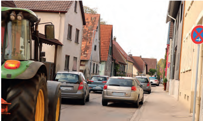
Der Bereich zwischen der Abzweigung Sohl und Katzenbergweg ist der engste Abschnitt und soll als Bauabschnitt 2 saniert werden