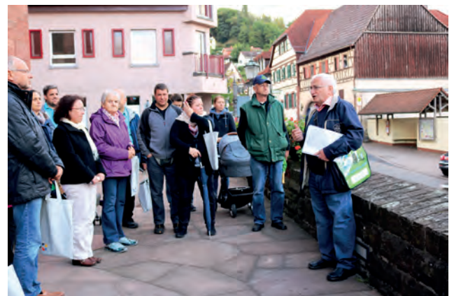
Die Fachwerkhäuser entlang der Bundesstraße waren bereits in alter Zeit fast alle Gasthäuser