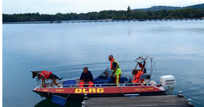
Wassersuchhund im Training

Training Winterhalbjahr: Neben dem regelmäßigen Montagstraining für die Jugendlichen zwischen 19:00-20:00 (ab 09.10.2017) haben auch die Erwachsenen endlich wieder im Hallenbad Zeit und Platz zum Schwimmen. Am Montagabend zwischen 20:00-21:00 und am Donnerstag zwischen 19:30-21:00 können alle Vereinsmitglieder zum Training kommen. Ob es dann ein paar hundert Meter oder zwei Kilometer werden, die Strecke bestimmt jeder/jede selbst. Interessenten sind jederzeit willkommen.