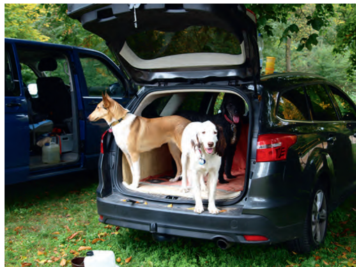
und wer darf als Nächster?

Rettungshunde am Baggersee: Vielen Dank an alle Helfer/innen, die am letzten Wochenende Zeit für die Rettungshunde hatten. Über 20 DLRG-Mitglieder kamen zusammen, um zu trainieren. Ob Flächen- oder Personensuche, Bootsfahrten für ungeübte Hunde oder Wasserrettungshunde, es gab viel zu tun. Davon in Kürze mehr.