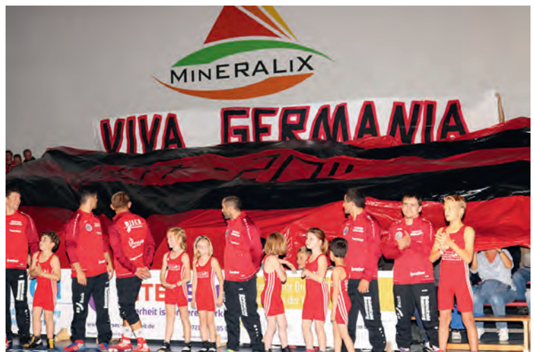
„Viva Germania“ - trotz allem: Die Zuschauer stehen

Fairness war beim Verband nicht mehr gegeben. Wir alle stehen hinter diesem Verein.“ Großer Beifall für beide Ansprachen. Dann ging es endlich los. Mit strahlenden Kindern an der Hand liefen die Sportler ein. Aber die Erwartungen der Fans sollten sich nicht erfüllen. Nicht einen einzigen Kampf in der ersten Hälfte konnten die Germania-Ringer siegreich gestalten. Wohl waren einige Kämpfe eng und knapp, aber letztendlich fehlte die entscheidende Konsequenz. Zur Pause lag der Gastgeber mit null zu 13 Punkten im Rückstand und das Publikum war deutlich ernüchtert. „Ich kann mich nicht erinnern, so etwas schon jemals erlebt zu haben“, sagten gleich mehrere. Eine Erklärung fanden sie allerdings nicht. Am Ende reichte es nur für zwei Siege. Nur ganz am Schluss erklang einmal das geliebte und gewohnte „Shalala SV Germania“ als ein kleines Trostpflaster. Am 21. Oktober erwartet Weingarten den ASV Nendingen.