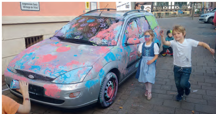
Kinderschminken und Fahrzeug bemalen für die Kleinen.