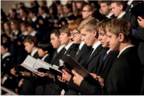
„Wandelkonzert“ zum Auftakt:

Die Luzerner Sängerknaben treten am jetzigen Samstag zunächst in der katholischen, dann in der evangelischen Kirche auf