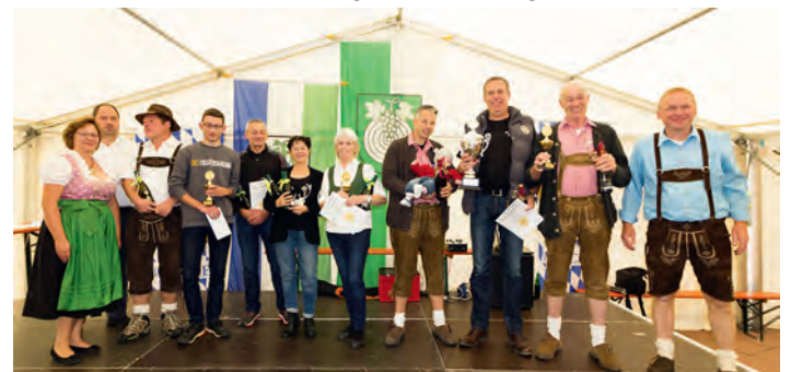
Sieger Pokalschießen 2017