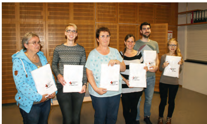
Neue Duschtücher erhielt die Bereitschaft des DRK