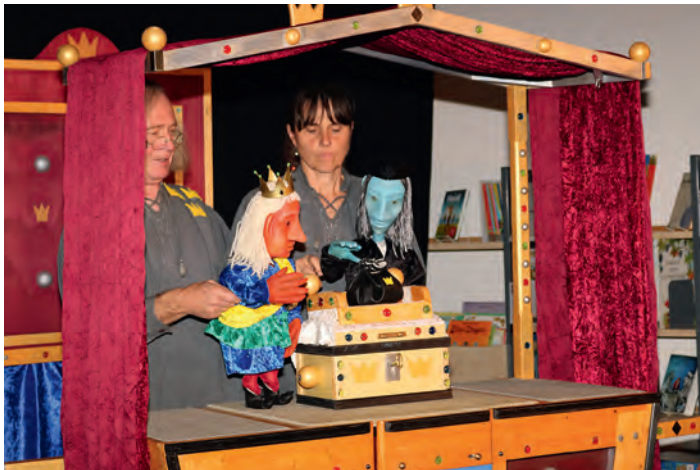
Der Kaiser und sein Minister.

Das Figurentheater „Himmelreicher“ kommt aus Karlsbad und hat sich 1982 gegründet. Anspruchsvolle Unterhaltung, eine altersgerechte Sprache und aufwändig gestaltete Figuren machen einen Besuch der Aufführungen zu einem echten Erlebnis.