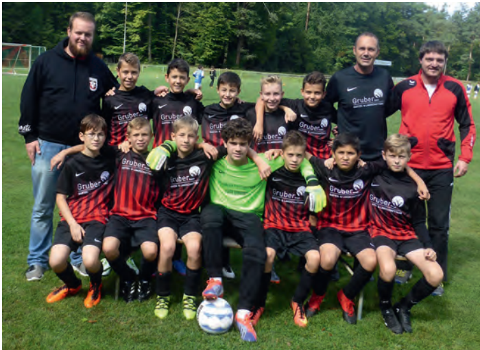
Die neuformierten D1-Junioren

Am vergangenen Samstag erzielte die neuformierte D1-Jugend gegen die SG Rüppur Karlsruhe ein 1:1 und bleibt somit auch nach dem dritten Spieltag weiterhin ungeschlagen. Trotz einer frühen Führung in der zweiten Spielminute kamen die Weingartener nur sehr schwer ins Spiel und gaben somit auch die Spielkontrolle an den Gegner leichtfertig ab. Dieser erzielte dann folgerichtig durch eine unkontrollierte Aktion vor dem eigenen Tor auch den Ausgleich. Nach der Pause entwickelte sich dann ein offenes und packendes Duell, wobei man seine hochkarätigen Konterchancen leider nicht verwerten konnte und sich am Ende leistungsgerecht mit einem Unentschieden zufrieden geben musste. Nach den ersten beiden gewonnenen Spieltagen gegen Siemens und Hohenwettersbach kann man auf einen erfolgreichen Start in die neue Staffelfrunde blicken. Am kommenden Donnerstag Abend gilt es nun den zweiten Tabellenplatz zu verteidigen und den positiven Trend zu bestätigen.