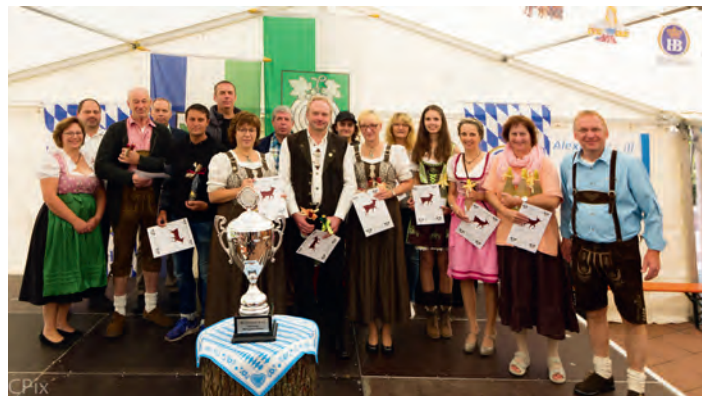
Sieger Paarschießen 2017

Grenzen gesetzt. Aber auch selbst konnten die Kinder Hand anlegen. Mit Fingerfarben durften sie ein Fahrzeug ganz nach ihrem Belieben bemalen und verzieren.