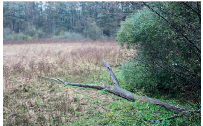
Im Oktober mit Vegetation