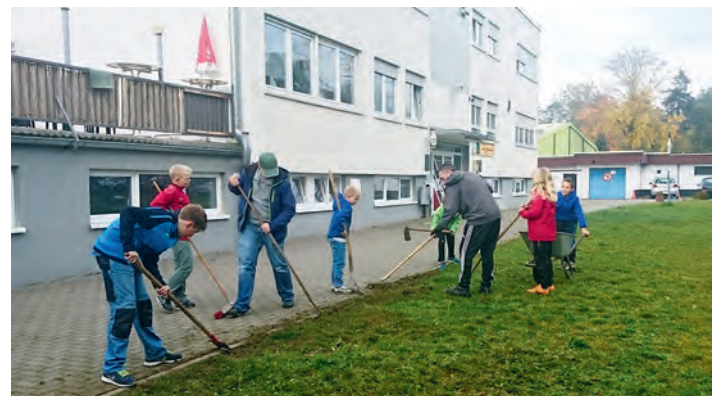
Arbeitseinsatz am Vereinsheim