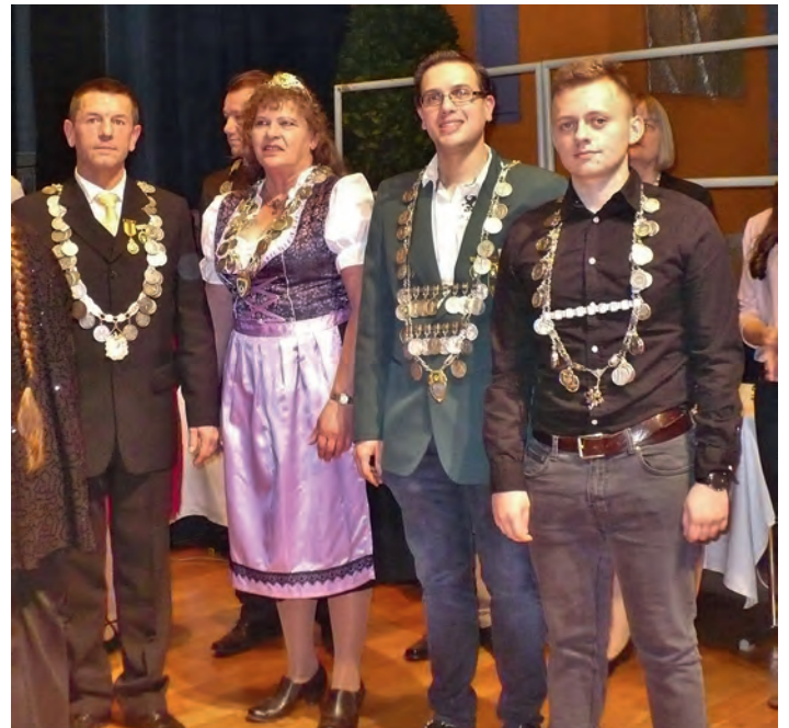
Die Schützenkönigsfamilie erhält den BSV-Königsorden.

Zahlreiche unterhaltsame Programmpunkte rundeten den Abend ab und so kann man sagen es war wieder ein schöner Abend unter Schützenfreunden.