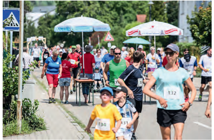
12.WLL 2017, fotoskop

blut.eV, Bürger für Leukämie- und Tumorerkrankte, Wilzerstraße 19, 76356 Weingarten, Förderverein blut.eV, Ringstraße 116, 76356 Weingarten, Montag bis Freitag 9.00 Uhr bis 12.30 Uhr, Tel. 07244/6083-0, E-Mail: info@blutev.de , www.blutev.de