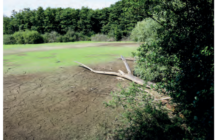
Im Juli war das Wasser nahezu völlig verschwunden und erste Trockenrisse bereits sichtbar.

viel regnen. Er hoffe jetzt auf einen ergiebigen Winter mit reichlich Schnee und Kälte, damit sich die Winterfeuchte im Boden halte. Sollte sich diese Trockenheit etablieren, gehe die Artenvielfalt verloren. Denn im Moor leben beispielsweise allein rund 40 Libellenarten, deren Lebensraum Wasser sei.