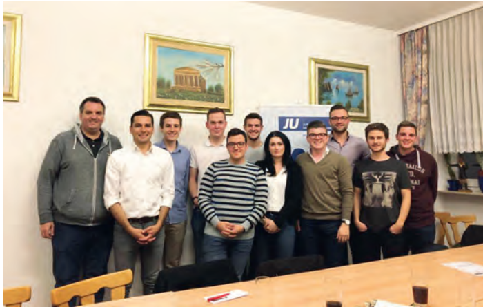
Junge Union Stutensee-Weingarten