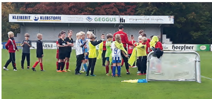
Die Trainer des DFB-Mobils im Einsatz...

Am 20. Oktober war das DFB-Mobil zu Gast im Waldstadion. Ein qualifiziertes Trainerteam des Badischen Fußballverbandes führte ein Mustertraining für F- und E-Junioren durch. In der anschließenden Besprechung wurden die Trainingsinhalte erläutert und weiterführende Fragen der FVgg-Jugendtrainer beantwortet. Eine tolle Aktion des DFB, die zum Ziel hat, die Qualifikation von Jugendtrainern zu verbessern.