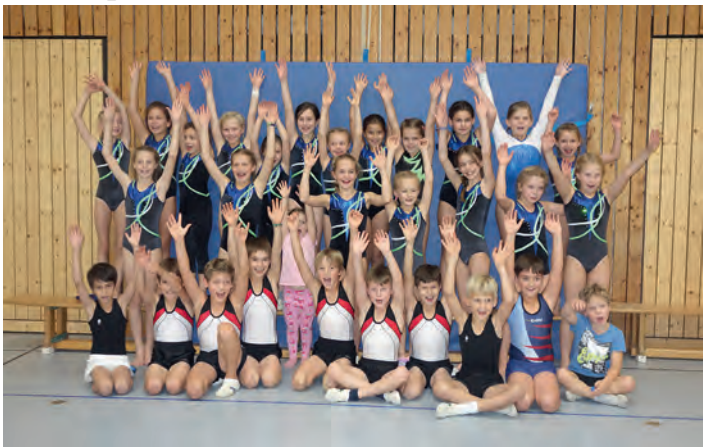
TSV-Nachwuchs beim Kids-Cup des Badischen Turner-Bundes

28 Jungs und Mädchen im Alter von 8 -12 Jahren traten beim Kids Cup des Badischen Turner-Bundes in Bühl an. Der Mehrkampf startete am Morgen mit den Disziplinen Schwimmen (25m/50m) und