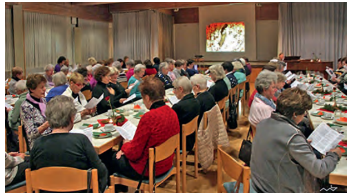
Ökumenische Adventsfeier 2015