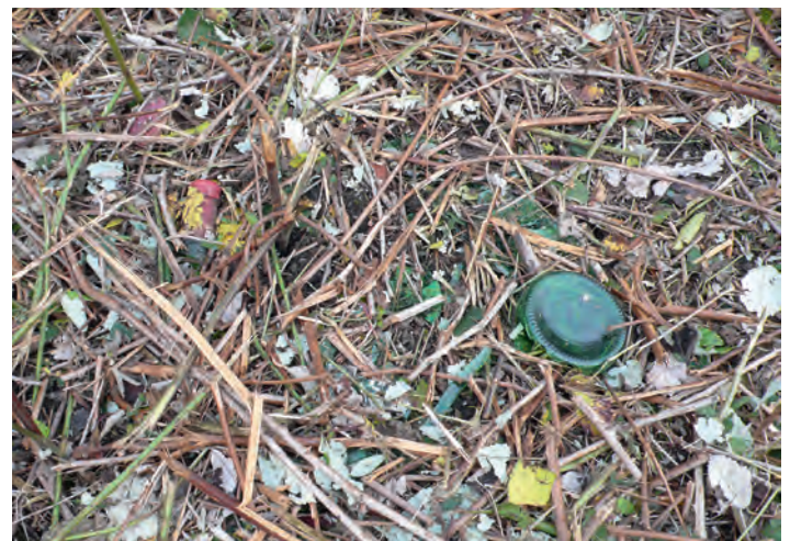
Diese Scherben liest niemand mehr auf

Erheblich erschwert wurde der freiwillige Einsatz allerdings durch eine erst in jüngster Vergangenheit durchgeführte kommunale Mäh- und Mulchaktion, in deren Verlauf zahllose Glas- und Kunststoffverpackungen ohne vorherige Sichtkontrolle regelrecht geschreddert und zerkleinert wurden. Ein nachträgliches Einsammeln der teilweise winzigen Partikel ist nicht mehr möglich, und mit zunehmender Besorgnis beobachten die Verantwortlichen der WBB, wie sich im Laufe der Zeit die Wegrandstreifen und angrenzenden landwirtschaftlichen Flächen in kaum mehr zu sanierende Altlastenstandorte verwandeln. Als Konsequenz wird daher die WBB auf politischem Wege versuchen, die derzeitige Praxis der Grünflächenpflege zu modifizieren und sich dafür einsetzen, dass Mäh- und Mulcharbeiten grundsätzlich erst nach einer vorherigen gründlichen Sichtkontrolle und Beseitigung von Fremdmaterial durchgeführt werden.