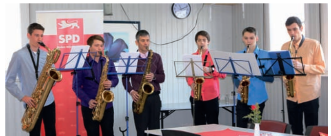
Die Saxofongruppe der Jugendmusikschule „Unterer Kraichgau“ unterhielt das Publikum mit gekonnten Vorträgen