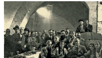
Weinprobe im Grundschulkeller 1937.