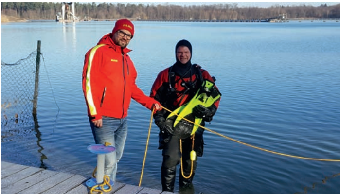
Taucher und Signalmann

Wenn sie Interesse an der ca. 2-jährigen Ausbildung zu einem Einsatztaucher haben können sie gerne ab Mitte Februar unverbindlich bei unserem Übungsabend im Walzbachbad Weingarten jeweils montags ab 19 Uhr vorbeischaun.